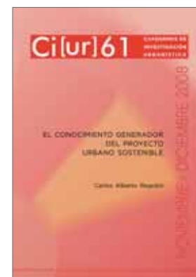
N.º 61: El conocimiento generador del proyecto urbano sostenible. Autor: Carlos Alberto Regolini Noviembre / diciembre 2008