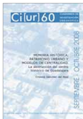
N.º 60: Memoria Histórica, patrimonio urbano y modelos de centralidad. La destrucción del centro histórico de Guadalajara. Autor: Cristina Sánchez del Real Septiembre / octubre 2008