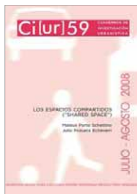
N.º 59: Los espacios compartidos ("Shared Space"). Autor: Mateus Porto Schettino y Julio Pozueta Echávari Julio / agosto 2008