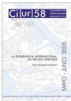
N.º 58: La experiencia internacional en peajes urbanos. Autor: Julio Pozueta Echávari Mayo / junio 2008