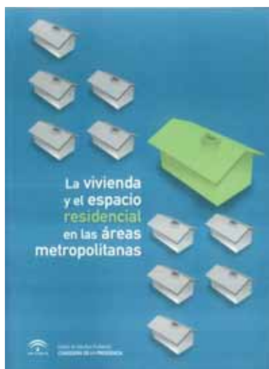
Centro de Estudios Andaluces, La vivienda y el espacio residencial en las áreas metropolitanas. Junta de Andalucía, 2007, 179 pp.