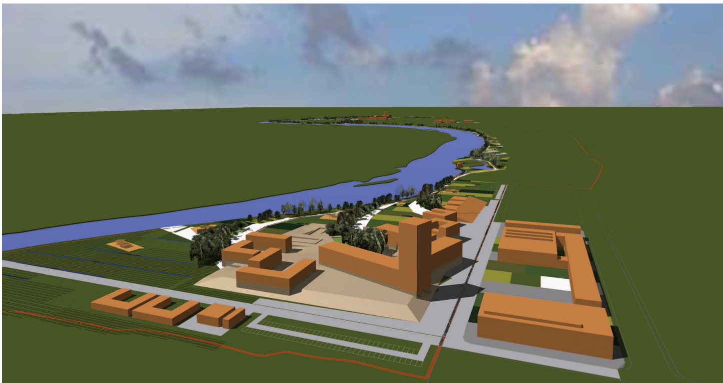
Figura 2: Perspectiva sur-norte del Área Sur-Campus de Villamayor.