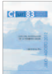
N.83: Patagonia. Antropización de un territorio natural