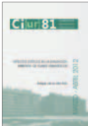
N.81: Aspectos críticos en la evaluación ambiental de planes urbanísticos

Enrique de la Villa Polo Marzo/Abril 2012