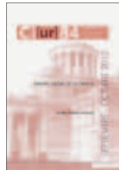
N.84: Madrid, ciudad de la ciencia

Emilio Parrilla Gorbeo Septiembre/Octubre 2012