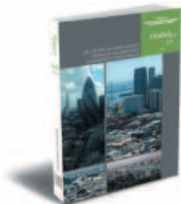
Revista del Instituto Universitario de Urbanística de la Universidad de Valladolid