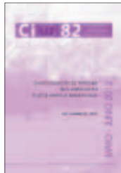
N.82: Caracterización de patrones bioclimáticos en tejidos urbanos residenciales

Enrique de la Villa Polo Marzo/Abril 2012