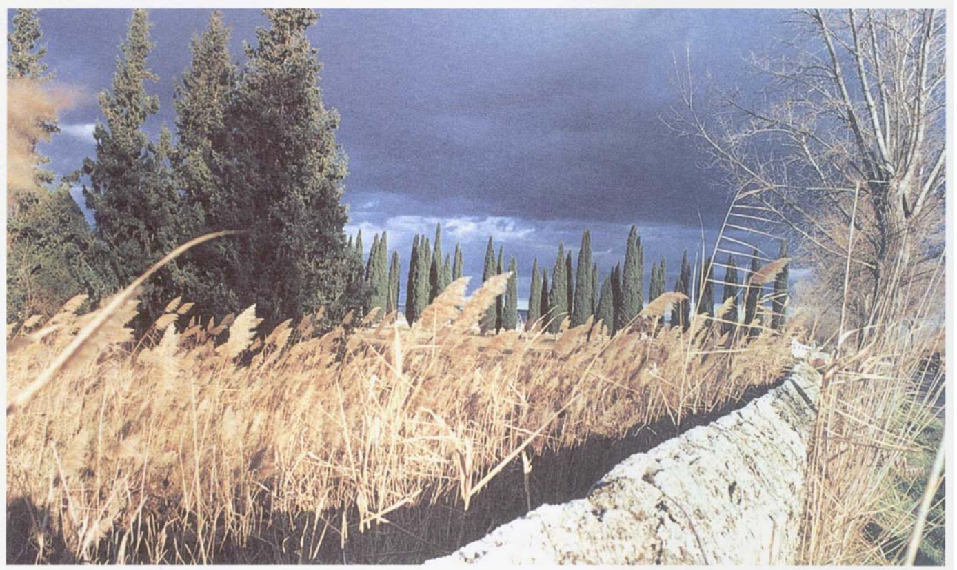
Fig. 3. Vegetación representativa de las riberas de los ríos.