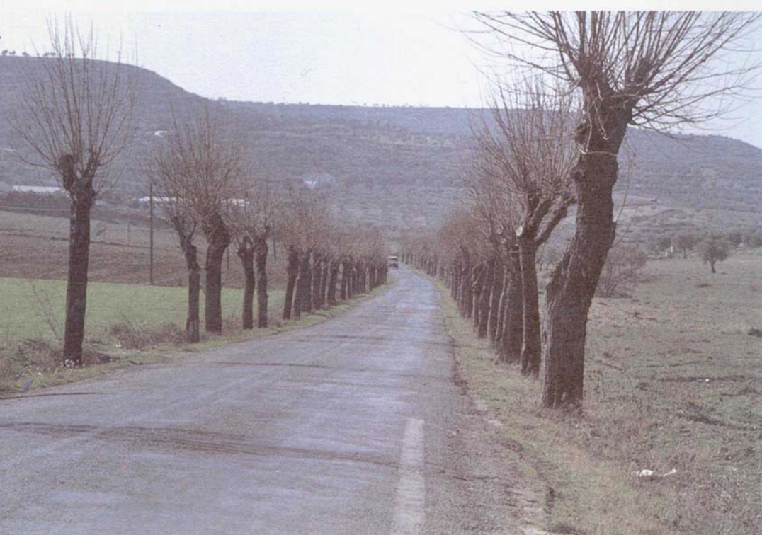
Fig. 5. Carreteras con trazados de la época de Primo de Rivera con árboles laterales y bien pegadas al terreno, que proponemos que no se modifiquen más que para hacer resurgir el adoquín.