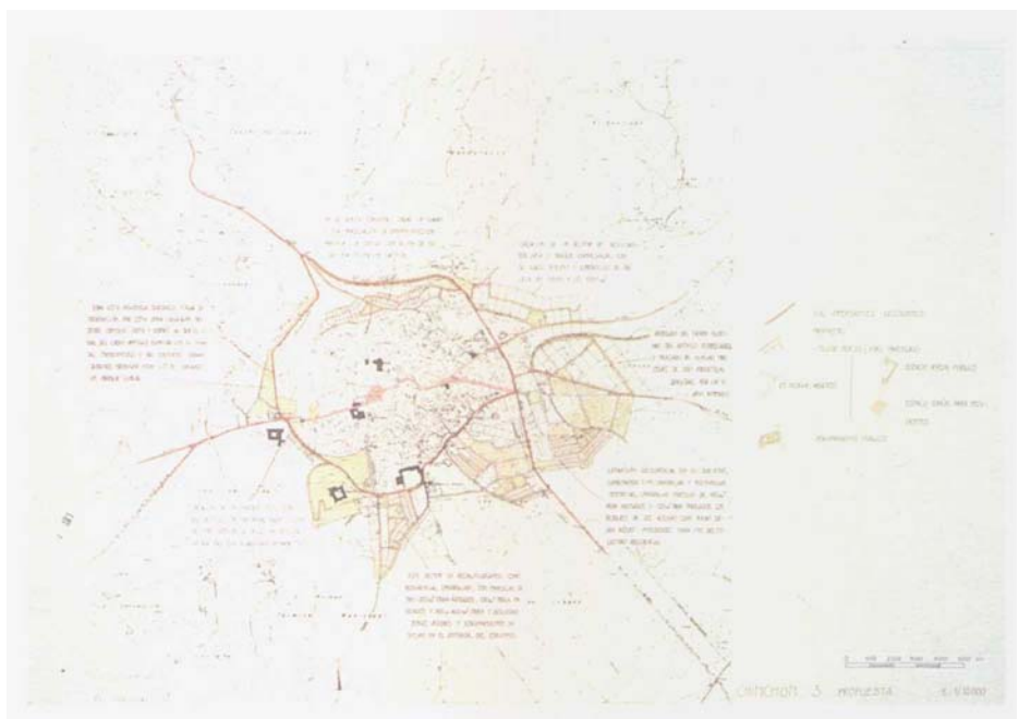
Fig. 7. Chinchón. Example of analysis and proposal based on a territorial conception.