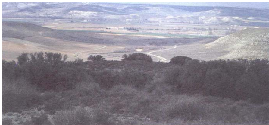
Fig. 2. Paisaje representativo del páramo asomándose al valle fluvial. Fig. 2. Typical landscape of the high plains overlooking the river valley.

Aranjuez es una de las cuatro ciudades que situadas en los cuatro puntos cardinales, con respecto a Madrid, tienen capacidad para contribuir a la deseada descentralización: Tres Cantos-Colmenar Viejo al Norte, El Escorial al Oeste, Alcalá de Henares al Este y Aranjuez al Sur. Es esta última a la que más le está costando incorporarse al desarrollo y es sin embargo la que tiene mejores condiciones de transporte. Se han dado varias explicaciones; nosotros creemos que se debe a la dificultad que entraña la transformación económica, que supone pasar de un sector prioritariamente secundario a uno terciario, y especialmente al Sur de Madrid. Por ello hemos pensado que la implantación de una Universidad que atraiga estudiantes de Madrid y Toledo, con enseñanzas que sean apropiadas a sus características históricas y naturales, como podrían ser las artísticas y agronómicas, podría ser un desencadenante de ese cambio. La cuestión consiste en que las enseñanzas se relacionen con