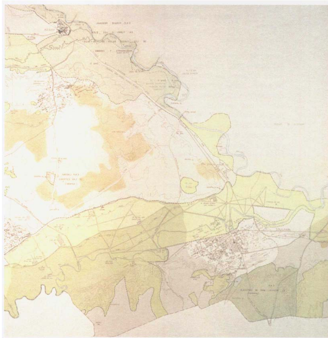
Fig. 4. Análisis y propuestas para la Comarca de Aranjuez. Incluye también: Titulcia, Colmenar de Oreja, Chinchón y Villaconejos. Original a El :25.00 Fig. 4. Analysis and proposal for the Aranjuez. Also includes: Titulcia, Colmenar de Oreja, Chinchón y Villaconejos.