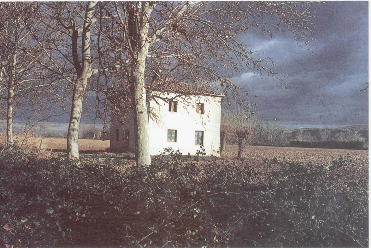
Fig. I. Edificio rural en el Valle del Tajo reutilizable como hito en los paseos recreativos.