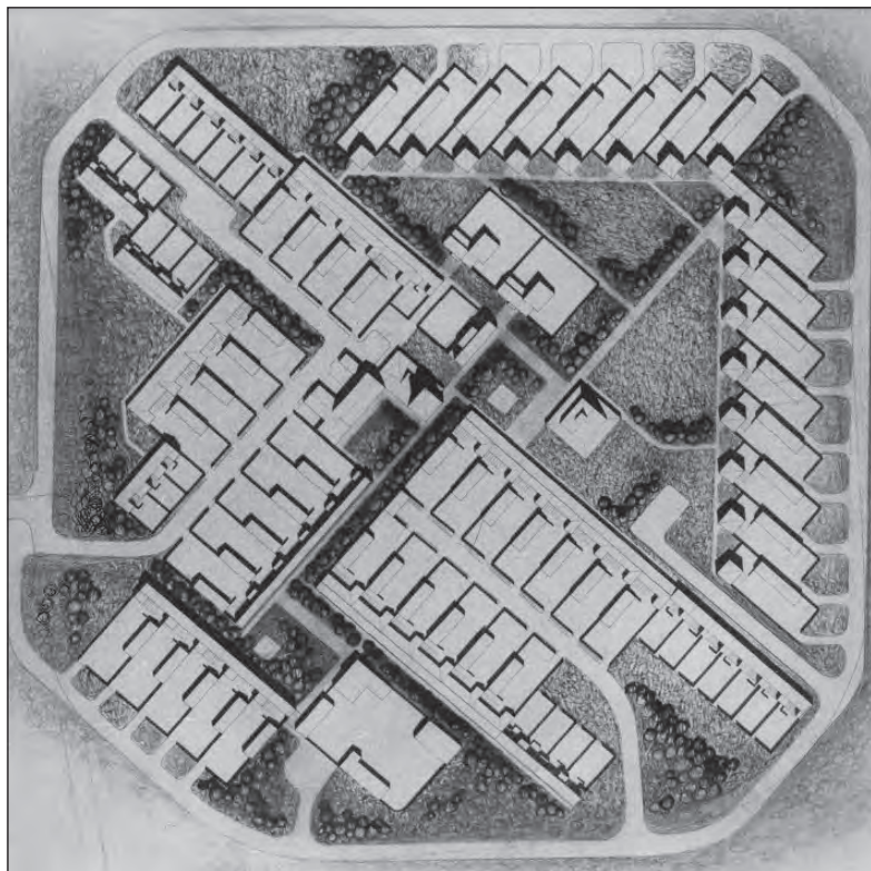
Poblado de colonización de Setefilla, Córdoba · 1965