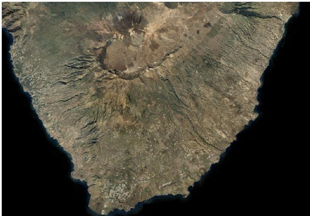
Figura 3. Ortofoto del sur de Tenerife durante la fase de renovación (año 2000).