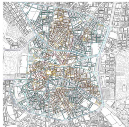
Figura 5. Tipologías de calles.

Para el plano vertical de la escena, cualquier decisión se subordina al orden, existente o reconstruido, de la fachada del edificio (figura 6), reconociendo cierta autonomía del zócalo comercial.