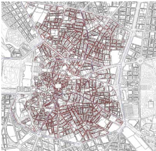
Figura 4. Locales del Ayuntamiento según Censo.

Los criterios para el plano horizontal de la escena urbana se subordinan a la coherencia entre la solución formal y la distribución funcional de la accesibilidad. En este sentido, una vez asentado un modelo general de movilidad, es de esperar que se generalice este criterio.