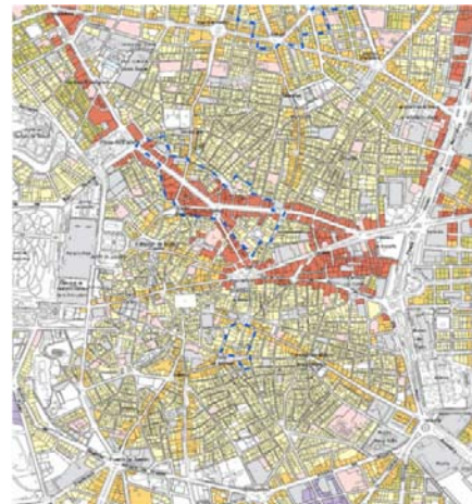
Figura 3. Niveles de uso del APE.00.01.

Adolece ese modelo público de una mínima coherencia o articulación entre los ámbitos de ejecución. Para el plano horizontal, el ámbito de ejecución escénica es el tramo de calle (figura 4) mientras que para el plano vertical es la fachada del local (figura 5), y sobre la jerarquía de actuaciones.