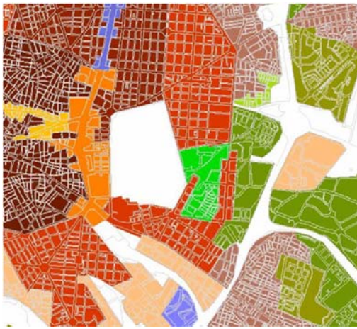
Figura 2. Mosaico de unidades de paisaje.