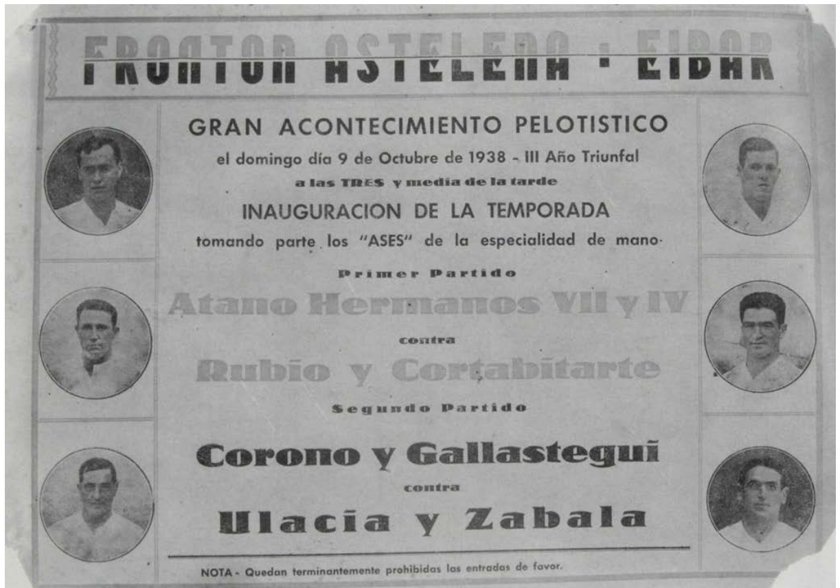
Figuras 1, 2 y 3. Desde arriba a la izquierda hacia abajo: agujero formado en una calle de Eibar por la caída de una bomba. Derecha: estado en el que quedó Eibar tras el bombardeo de la Guerra Civil; abajo: cartel que anuncia los próximos partidos de pelota. NOTA: las tres imágenes corresponden a la misma época.