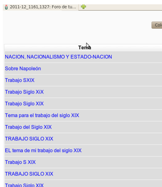
Figura 2. Foro con los mensajes de las propuestas temáticas del alumnado.

Se observa, en líneas generales, que el alumnado español es bastante reticente a realizar trabajos académicos en grupo, pero a través de este mismo foro (Fig. 2) y del tablón de anuncios, animamos a los estudiantes a abrir nuevos hilos en el foro, señalando temas de investigación, a la espera de que otros compañeros respondan afirmativamente sumándose a alguna de las temáticas, de acuerdo a sus preferencias. Entre los alicientes ofrecidos como impulso a los estudiantes para que decidan trabajar en grupo se encuentra la idea de que es más fácil la coordinación a través de Internet (foros, correo electrónico, Google Docs, etc.) que a nivel presencial, donde es necesario combinar forzosamente las variables espacio-temporales.