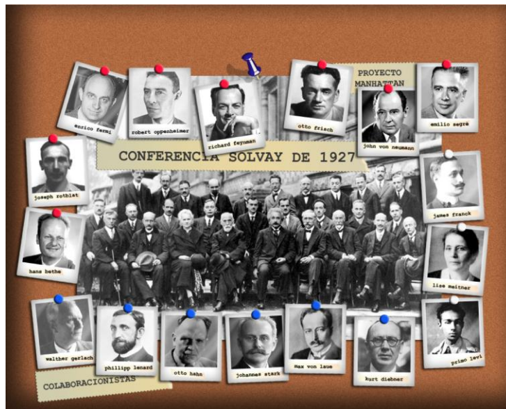
Figura 2. Montaje realizado para la asignatura de Ciencia y Conciencia. En la imagen aparecen además de los científicos que asistieron a la conferencia Solvay de 1927, algunos científicos relevantes de la época inicial de la Física Cuántica.

Proyecto Manhattan y en el desarrollo de la bomba atómica alemana (Figs. 2 y 3).