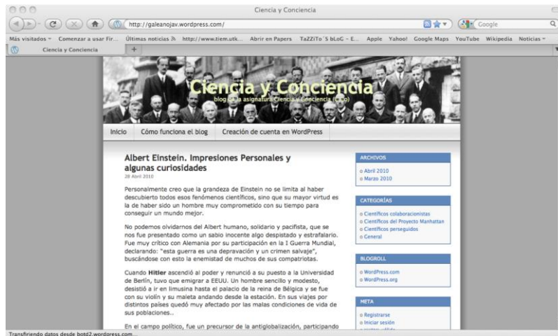
Figura 4. Captura de la pantalla de unos de los artículos publicados por los alumnos en el blog de la asignatura.