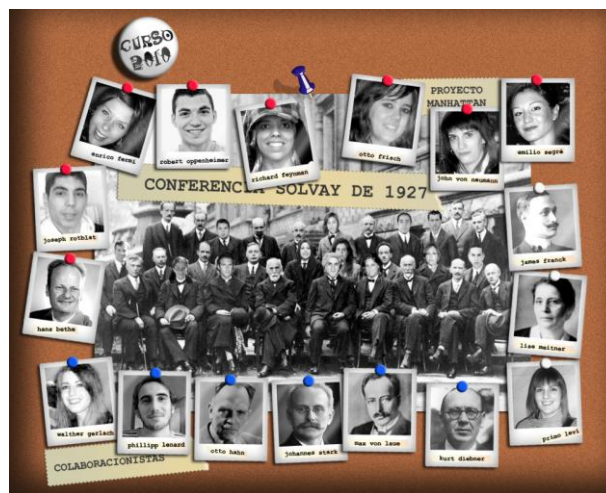
Figura 3. Montaje realizado para la asignatura de Ciencia y Conciencia. En la imagen aparecen parte de los alumnos del curso 2010 en lugar de sus científicos asignados.