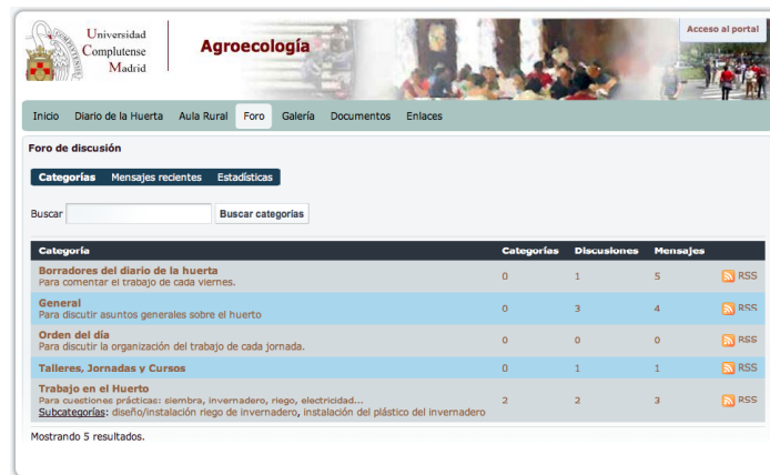
Figura 2. Foro de discusión.

miembros del grupo con más experiencia o buscamos y añadimos las aportaciones de expertos externos al proyecto.