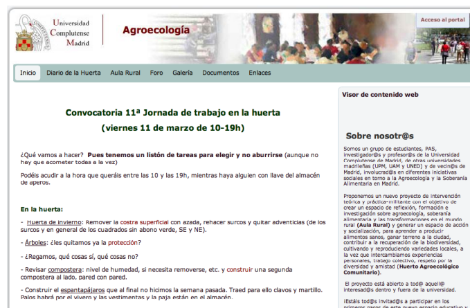
Figura 1. Portal web UCM. http://portal.ucm.es/web/agroecologia .

Ello nos ha llevado a explorar dos estrategias que detallaremos en los siguientes apartados. Por una parte hemos adecuado las herramientas incluidas en el portal web a nuestras necesidades; y por otra, hemos compaginado esta herramienta con otros servicios de proveedores privados (Google, Yahoo) que nos permiten mayor flexibilidad a la hora de alcanzar nuestros objetivos.