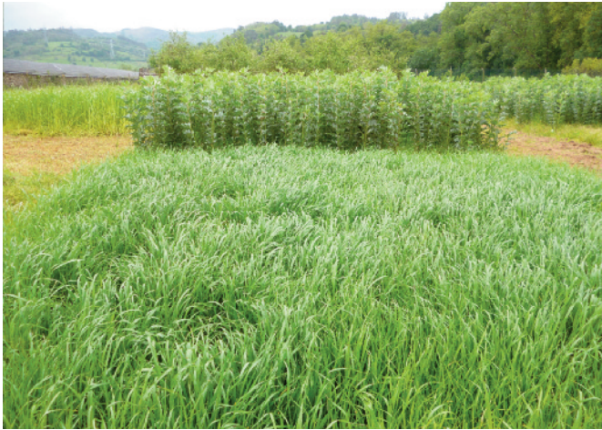
Aspecto general de los cultivos invernales de raigrás italiano y haba forrajera en ensayo en pequeña parcela.

Overview of the Italian ryegrass and the fava bean in experimental plots.