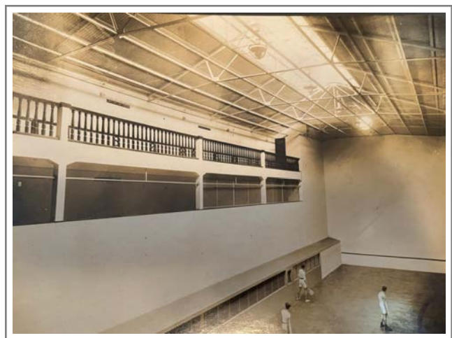
Figura 1: Un detalle de la cancha de Pelota, 1931.

La instalación del club en una cancha de pelota favoreció la difusión de este deporte, dado que el espacio central de la sede ubicada