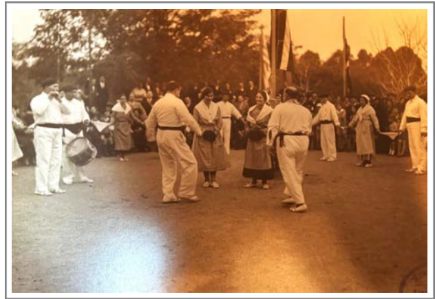
Figura 2. El izamiento de la bandera vasca dio motivo para la realización de una fiesta verdaderamente patriótica. Álbum de fotografías 3. 6 de agosto de 1933 a 30 de diciembre de 1935.

Además de servir como un vínculo unificador entre los propios asociados, la pelota fue fundamental también para establecer lazos con otros grupos poblacionales en Montevideo.