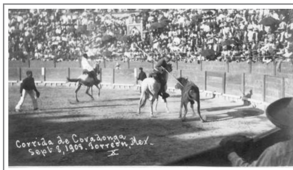
Figura 1. Corrida de Covadonga, 08 de septiembre de 1908.

Al año siguiente, se rifó un automóvil “Dodge” durante los festejos de Covadonga ( El Siglo 28 de agosto de 1924), además, El Siglo (9 de septiembre de 1924) destacaba la esplendorosa unión entre mexicanos y españoles en torno a esta celebración. En esta edición, también se realizó un juego de fútbol entre el Nacional y el España en el Parque. La nota, además de utilizar un lenguaje anglo para describir las jugadas 17 , enfatizaba las diferencias físicas entre ambos equipos al señalar las estaturas y pesos inferiores de los nacionales respecto a los españoles 18 . En relación con la ‘castellanización del football ’, El Siglo inició la década de 1920 utilizando términos anglos en torno a este deporte, y para finales de esta, ya los había ‘castellanizado’.