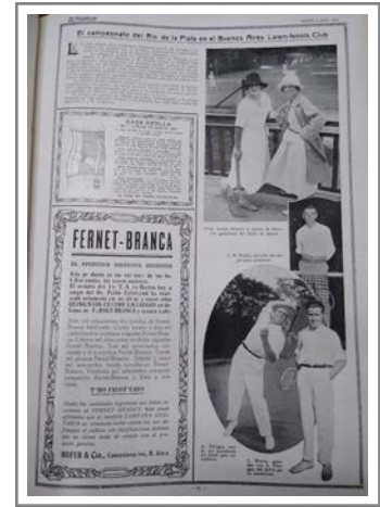
Figura 4. Resultados finales del Campeonato del Río de la Plata en el número 50 de El Gráfico

Torreadella i Flix (2012, 12) señala que en la primera etapa de la difusión de la educación física en la prensa española los artículos eran presentados por especialistas como médicos, militares, profesores o pedagogos. Si bien destaca la circulación de revistas sobre educación física a finales del siglo XIX, apunta que entrado el siglo XX el predominio es del deporte por sobre la educación física, con las principales publicaciones especializadas centradas en acontecimientos deportivos y no en la difusión de la educación física (Torreadella i Flix 2012, 17). No parece ocurrir así en el caso argentino de El Gráfico , publicación en que, si bien predominaba la información sobre certámenes deportivos nacionales e internacionales, daba lugar a todo un conjunto de publicaciones centradas