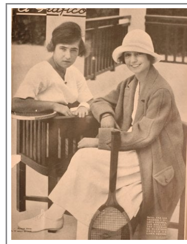
Figura 1. Tapa de la edición número 48 de El Gráfico

Constancio C. Vigil fue un escritor y editor uruguayo que dirigió la Editorial Atlántida entre 1918 y 1925. De acuerdo a Bontempo (2016, 331), sus intereses radicaban en la propiedad de la tierra, la posibilidad de