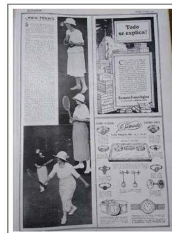
Figura 3. Informe sobre el campeonato del Río de la Plata en el número 48 de El Gráfico

Estos recuadros, que no tienen firma, aparecen de manera irregular a lo largo de los números revisados. A pesar de su falta de constancia, nos permiten ver el modo en que la revista expresaba, a veces de una manera brutalmente explícita, su posición higienista, pronunciándose sobre los beneficios que el deporte le traía no sólo al cuerpo masculino o femenino, sino a la nación en general. Una nación que abrazaba el desarrollo del capitalismo y precisaba para ello una clase obrera productiva: “Iniciése usted en algún sport, si ya no practica alguno. Esto lo hará más fuerte, más alegre y aumentará su aptitud para el trabajo” ( El Gráfico 1920, 9).