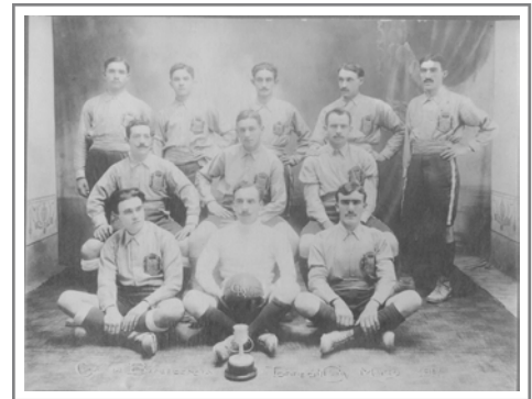
Figura 2. Club Deportivo Victoria posando con la Copa Beneficencia 1917.