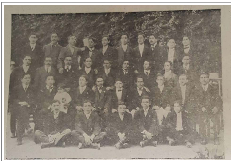
Grupo de socios del American F.C. (Bautista y Salinas, 1910, 607).

La metodología empleada en este estudio entregó un panorama general, afirmando nuestra hipótesis y constituyendo un cierto peldaño desde donde abordar el desarrollo deportivo a inicios del s. XX en la provincia de Concepción. Sin embargo aún hay mucho que investigar. Esta provincia es reconocida por ser frontera entre el mundo mapuche y occidente (primero en la colonia y luego con el Estado de Chile), además de ser uno de los polos industriales más importantes del país. En ese sentido, estudios desde una mirada como la historia económica o cultural en cuanto al impacto de las prácticas deportivas en estos mundos tan dispares serían interesantes, los cuales podrían implementar diversas metodologías y enfoques. Así también el estudio de los medios de comunicación, al considerar la construcción de imaginarios sociales y el cruce con la disciplinas como la Antropología, puede entregar interesantes investigaciones sobre un tópico escasamente abordado.