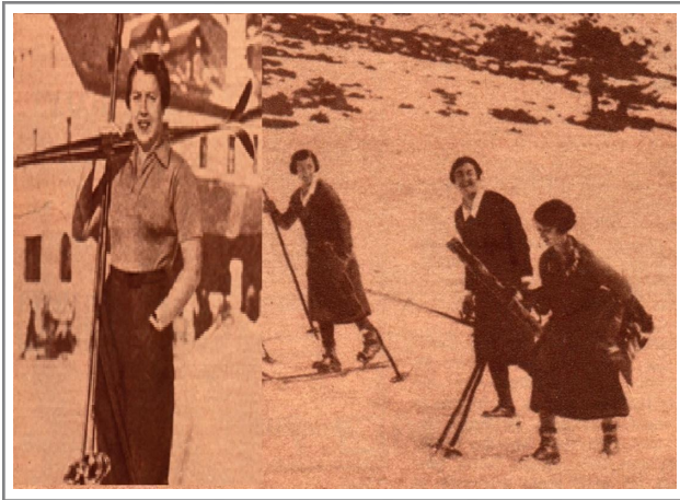
Figura 9. El gran deporte en la montaña.

deportivos, en este caso, desde el ámbito alpino hacia el mundo hispano, que presenta a las mujeres como protagonistas activas de una modernización corporal.