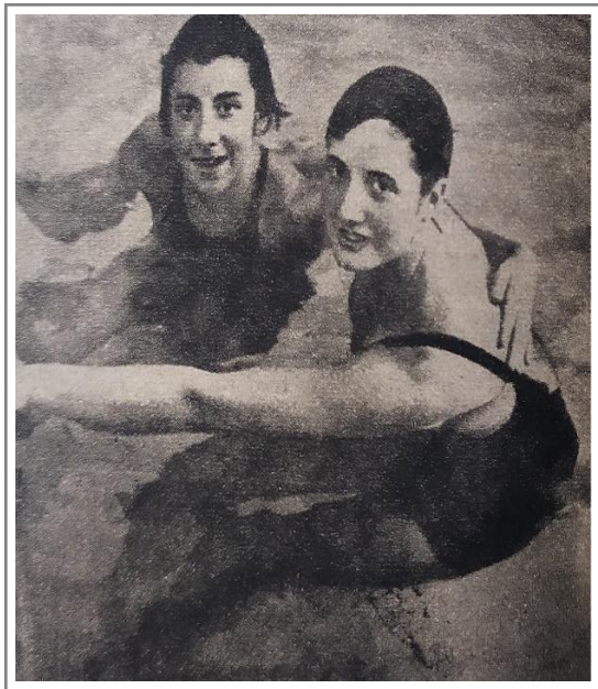
Figura 7. La mujer española Ante los campeonatos Interuniversitarios de Atletismo.

La fotografía que acompaña el texto refuerza una doble dimensión en la representación de estas atletas: por un lado, se subraya su condición de deportistas destacadas, batientes de récords nacionales, y por otro, se enmarca su presencia en un registro visual que resalta la belleza y la gracia corporal, retomando códigos de la visualidad femenina tradicional. La imagen, que muestra a ambas mujeres en la piscina, sonrientes y en actitud distendida, las presenta como cuerpos sumergidos, pero plenamente visibles, en una composición que sugiere intimidad, armonía y estética acuática más que esfuerzo o entrenamiento.