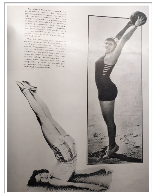
Figura 10. Deportes . Fuente: Deportes , 1930, n.º 2, p. 21. Acervo: Biblioteca Nacional.

Las figuras femeninas retratadas encarnan una estética particular: son mujeres elegantes, serenas, bien vestidas, pero con el cuerpo preparado para la acción, simbolizando una feminidad capaz de adaptarse al rigor físico sin renunciar al estilo. Esta combinación entre sofisticación visual y energía vital construye un modelo de deportista moderna que no solo ocupa espacios de esfuerzo, sino que también los vuelve deseables y socialmente legitimados. En este sentido, como analiza Soares (2011), la vestimenta utilizada en las prácticas deportivas estableció un nuevo código de comunicación, en el que se articulaban cuerpo, comodidad y feminidad, redefiniendo las formas de representar y experimentar el cuerpo femenino en movimiento.