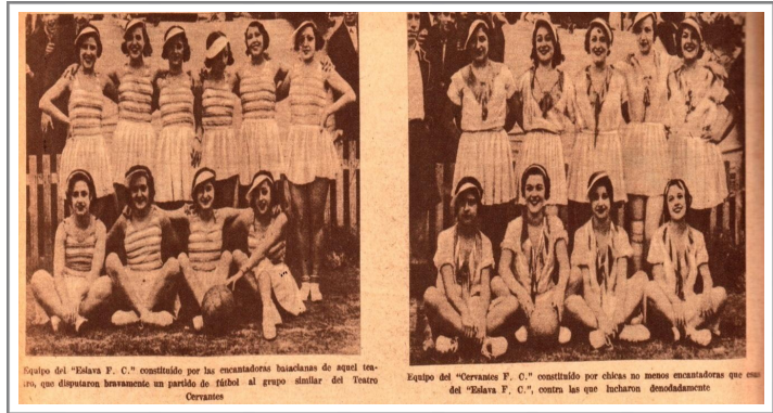
Figura 2. El fútbol coreográfico femenino.

Desde la perspectiva de Sontag (2006), las imágenes fotográficas no son solo representaciones, sino fragmentos seleccionados de la realidad, que conllevan una operación de recorte, puesta en escena y mirada. Esta fotografía de grupo responde claramente a una “puesta en escena colectiva”, donde las mujeres, alineadas según una lógica jerárquica o estética, son inscriptas en una narrativa visual de pertenencia, orden y disciplina, a la vez que reafirman la respetabilidad de su participación deportiva mediante una disposición corporal contenida y vestimenta adecuada.