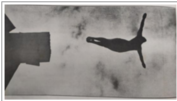
Figura 4. Magnífica trayectoria de la nadadora yankee Georgia Coleman.

Estas imágenes, publicadas en las revistas Deportes y Rush , se diferencian de las presentadas con el “fútbol coreográfico femenino” en cuanto al tono, pero mantienen ciertas continuidades, como el uso del cuerpo femenino como vehículo de mensajes visuales que condensan valores de época, como la modernidad, la salud y la competencia. Al mismo tiempo, como plantea Burke (2005), estas fotografías no deben ser leídas solo como ilustraciones de la realidad, sino como “documentos de cultura visual” que construyen activamente una imagen social del deporte femenino. Su uso en publicaciones masivas da cuenta de una pedagogía visual 1 en la cual el deporte de mujeres no solo se legitima, sino que se regula bajo ciertos códigos visuales: cuerpos estilizados, técnicos, controlados y exhibidos en el umbral entre la competencia y el espectáculo.