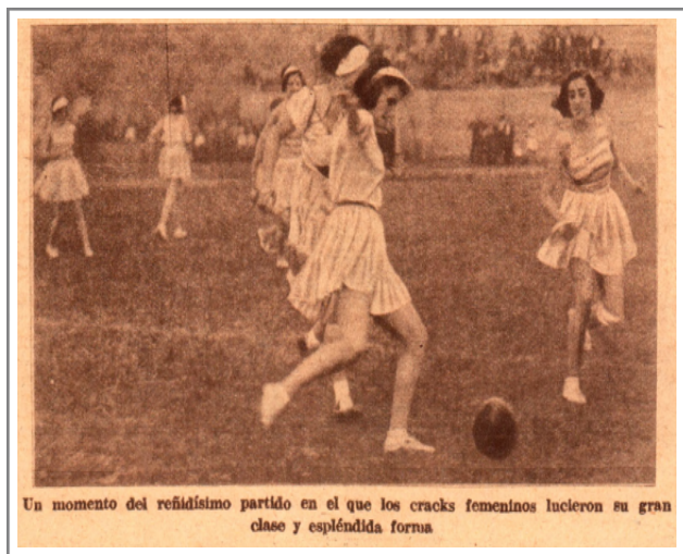
Figura 1. El fútbol coreográfico femenino.

La escena retratada en la figura 1 refuerza varios de los elementos que caracterizan esta estrategia de espectacularización del cuerpo femenino, donde ellas, vestidas con faldas cortas, camisetas sin mangas largas y vinchas, aparecen en movimiento sobre un campo de fútbol. La