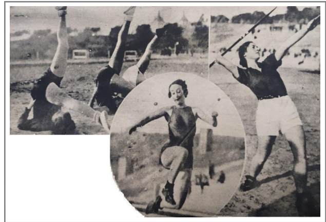
Figura 6. La mujer española ante los campeonatos interuniversitarios de Atletismo.

Estas imágenes de las escolares madrileñas en distintas fases del entrenamiento condensan, por tanto, una doble operación simbólica: por un lado, legitiman la figura de la atleta femenina como parte del presente moderno; por otro, configuran visualmente una pedagogía del cuerpo entrenado, estético y eficaz, en línea con los modelos internacionales de corporalidad que circulaban en el periodo a través de las revistas ilustradas. Se trata, como afirman Giulianotti y Robertson (2007), de una articulación entre lo global y lo local, donde el cuerpo femenino se convierte en soporte de proyecciones culturales que trascienden lo nacional, pero también en campo de disputa y negociación de nuevos sentidos sobre la feminidad atlética.