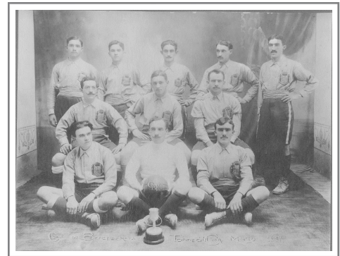
Figura 2. Club Deportivo Victoria posando con la Copa Beneficencia 1917.