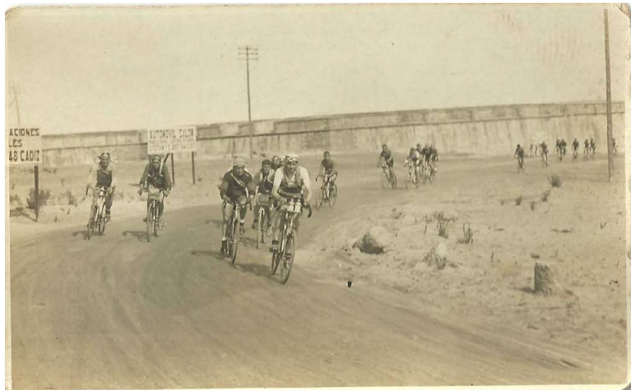
Fig.10: Foto de los corredores en su paso por la provincia de Cádiz, según se observa en los carteles del fondo.