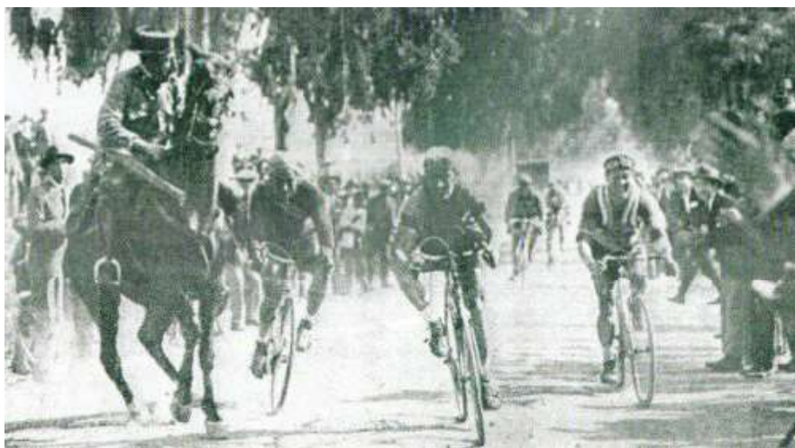
Fig.7: Polémica llegada de la última etapa, con el caballo de la Guardia Civil desbocado a la izquierda