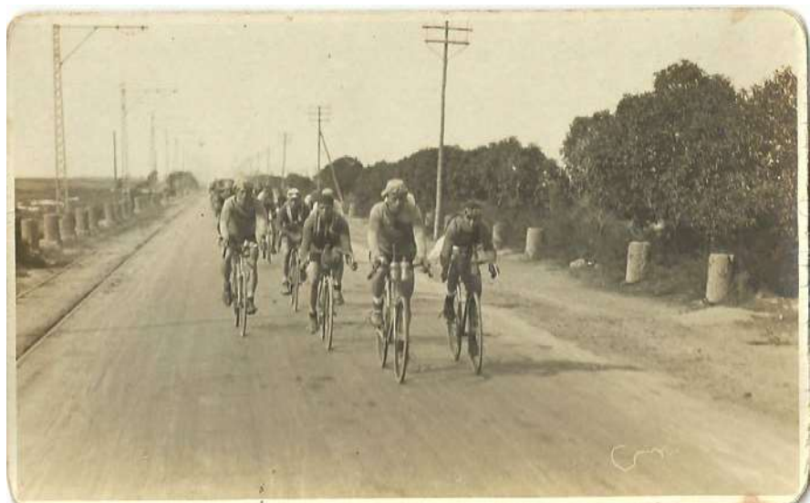
Fig. 11: Otra fotografía de la I Vuelta Ciclista a Andalucía.