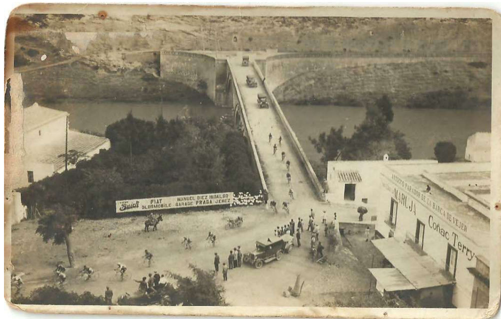
Fig. 3: Primera Vuelta Ciclista a Andalucía pasando por la Barca de Vejer de la Frontera.

“La proyectada vuelta a Andalucía, la idea que largo tiempo germina en la mente de un grupo de entusiastas del ciclismo, parece que dentro de breves días tomará cuerpo, y no tardará mucho en que sea una realidad el deseo de los sueñan en incluir el nombre de Andalucía entre las vueltas regionales, como la del País Vasco, Cantabria, Cataluña y Castilla. Consta de cuatro etapas, a celebrar en los últimos días de octubre y primeros de noviembre próximos, dividida del modo siguiente: