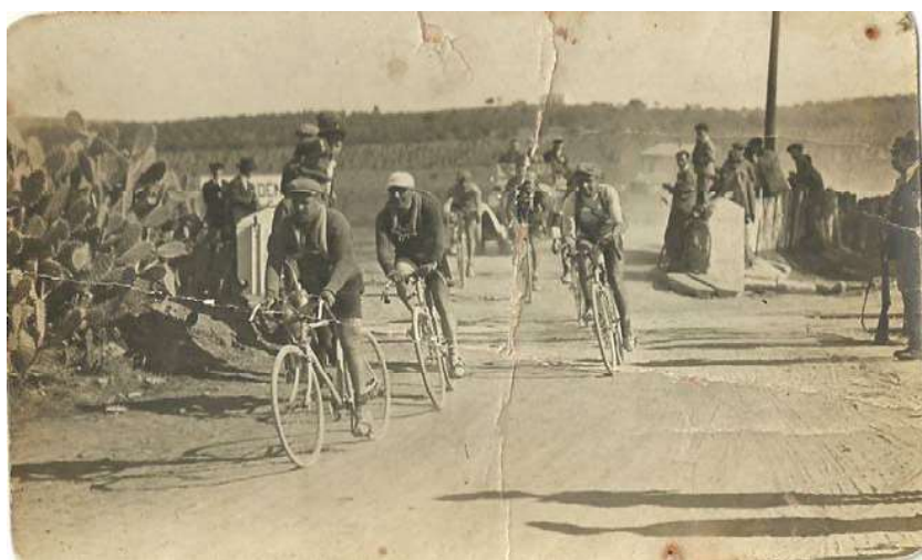
Fig. 14: Otra fotografía de la I Vuelta Ciclista de Andalucía. Es de resaltar la vigilancia de todo el recorrido por la Guardia Civil, como se observa al margen derecho de la foto.