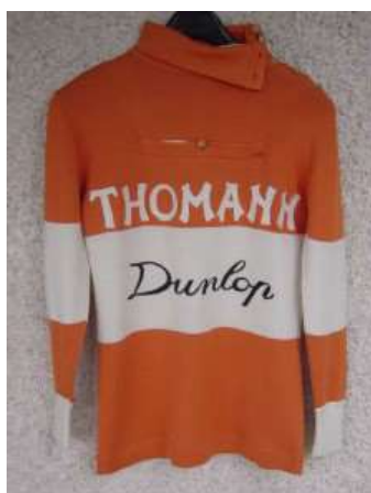
Fig. 18: Maillot del equipo de Thomann Dunlop.