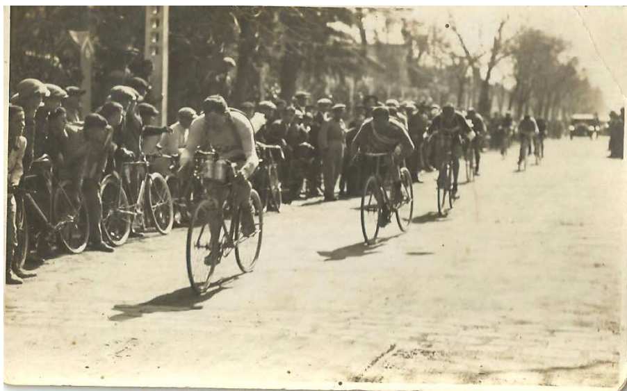
Fig. 21: Llegada de la I Vuelta Ciclista a Andalucía por la Avda. Reina Victoria (actual Palmera, con muchos espectadores y algunos con sus bicicletas.