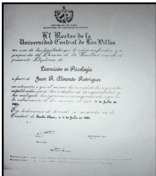
Figura 1. Título de Licenciado en Psicología deporte