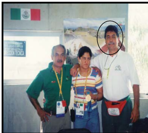
Figura 4. Alvaredo junto a la pesista mexicana Soraya Jiménez Mendivil, oro en los juegos olímpicos de Sídney 2000.

Otra competencia de gran nivel que se muestra en la tabla 5, en la que Alvaredo participó con el equipo de Cuba como psicólogo, fue en el Primer Clásico Mundial de Béisbol, evento en el que finalizó en segundo lugar, solo superado por la selección de Japón.