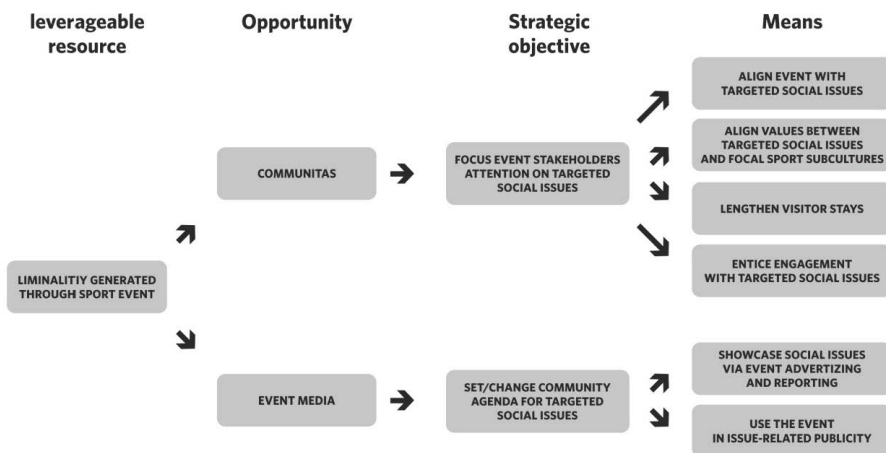
Figure 3. Modelo de alavancagem social (O'Brien, Chalip, 2008:324) 54

Posteriormente ao modelo social já avançado por Chalip (2006) 52 , O'Brien e Chalip (2008) 53 reforçaram esta direção de investigação e conceberam um modelo de alavancagem social (Fig. 3). Nesta proposta os objetivos estratégicos são “focar a atenção dos stakeholders dos eventos em temas sociais” e “definir/alterar agenda da comunidade para as questões sociais direcionadas”. Neste modelo os eventos não são apenas entendidos numa perspetiva de entretenimento e celebração, mas pretendem também subsidiar questões sociais. Na nossa opinião é importante alavancar também o espírito de celebração e de interação social facilitada pela atmosfera que envolve o evento, na medida em que o espírito de união pode ser facilmente induzido pelos eventos desportivos.