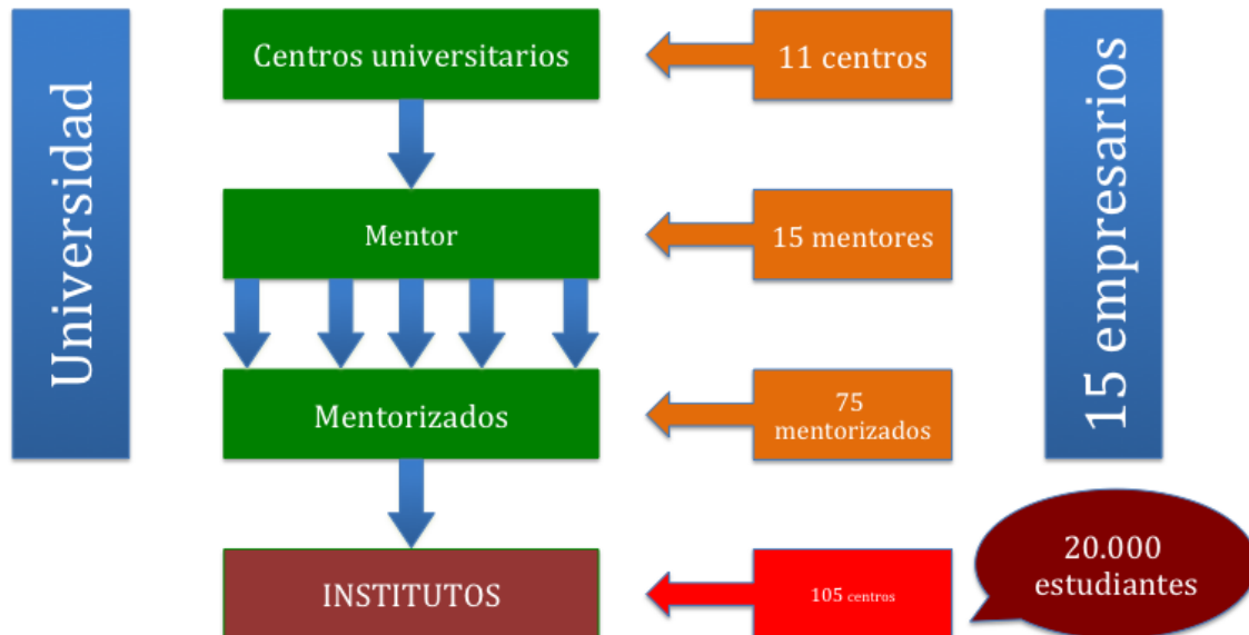
Gráfico 3. Programa de Formación a mentores.