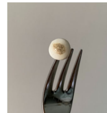
Fig. 5. Muestra parcialmente quemada como resultado ensayo de conductividad térmica

Existe la posibilidad de que nuestro material en circunstancias excepcionales se encuentre a temperaturas muy elevadas, por ello realizaremos el siguiente ensayo para determinar su capacidad de conductividad térmica.