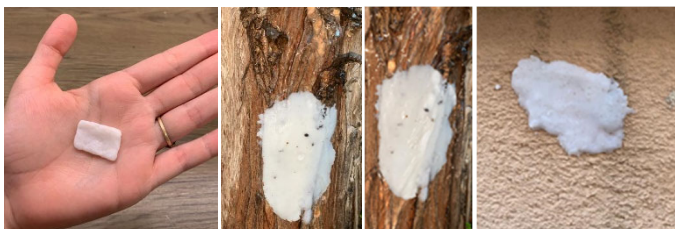
Fig. 7. Muestras del material adherido a diferentes superficies

Respondiendo a la pregunta de investigación: ¿Se puede crear un material capaz de adherirse a cualquier superficie que necesite un recubrimiento resistente al agua?, para la que se había formulado la hipótesis según la cual sí será posible crear un material que junte ambas propiedades con el fin de crear un material impermeable aplicable tanto a superficies lisas como rugosas, basándonos en los datos y resultados de los ensayos, afirmamos que se acepta. Puesto que cómo podemos apreciar con los ensayos, sí es viable mezclar ambos productos y además nos dan exactamente las propiedades que buscábamos, logrando así nuestro objetivo.