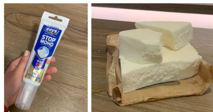
Fig. 1. Silicona neutra (izquierda) y cera de soja empleadas para la fabricación del material

A lo largo de la práctica se utilizaron varias medidas de seguridad para evitar el riesgo de intoxicación a causa de los materiales empleados (mascarilla, guantes...).