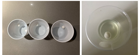
Fig. 4. Resultados ensayo de corrosión en diferentes medios salinos (izquierda) y en 40 ml de lejía (derecha)

El segundo medio estará compuesto por 40 ml de lejía en el que sumergiremos la muestra esférica. Pasadas 72 h la esfera permanece intacta, no hay cambios visibles en su estructura. Podemos concluir que nuestro material además de ser impermeable es resistente a medios salinos y corrosivos como podría ser la lejía.