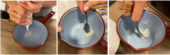
Fig. 3. Proceso de mezclado de la silicona neutra con la cera de soja

Habrá que remover en un recipiente ambos reactivos hasta obtener una mezcla homogénea.