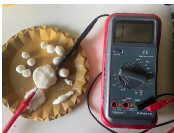
Fig. 6. Prueba de conductividad con Multímetro Velleman DVM892

Para realizar el ensayo emplearemos un multímetro Velleman DVM892 e introduciremos las puntas o cables cada una en un extremo de una pieza del material para medir el voltaje. Como vemos en la imagen obtenemos como resultado un voltaje prácticamente nulo, por lo que el material no conduce la electricidad.