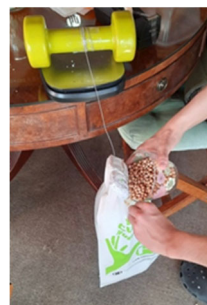
Fig.4. Ensayo de tracción

extremo de la cuerda, se colocaba la probeta y una bolsa a la que se añadían diferentes pesos para deformar el material.