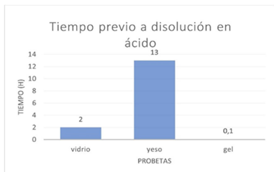
Fig. 6. Comparativo de ensayo de corrosión

La siguiente gráfica compara el tiempo de las probetas que no resistieron el medio ácido en deshacerse: