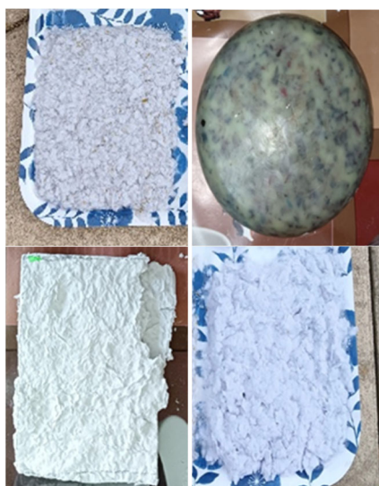
Fig. 3. Probeta de vidrio, cera, yeso y gel (izquierda a derecha, arriba abajo)

En cambio, tanto para la probeta de yeso como la de gel, a la vez que se iba triturando el papel se iba añadiendo el aditivo, destacando que el yeso se encuentra en estado líquido. Finalmente, se dejan enfriar y las probetas ya estarán listas para ser ensayadas.