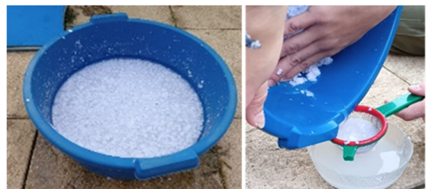
Fig.1. Papel diluyéndose y eliminación del exceso de papel

Para obtener nuestras probetas comenzamos formando, la matriz de papel. En primer lugar, cortamos unos folios, anteriormente utilizados para aportarles una nueva vida, en pequeños trozos y los añadimos en un recipiente con 100 ml de agua para que se puedan disolver. A continuación, eliminamos el exceso de agua utilizando un colador y lo dejamos secar durante 48 h para después, triturarlos con una batidora.