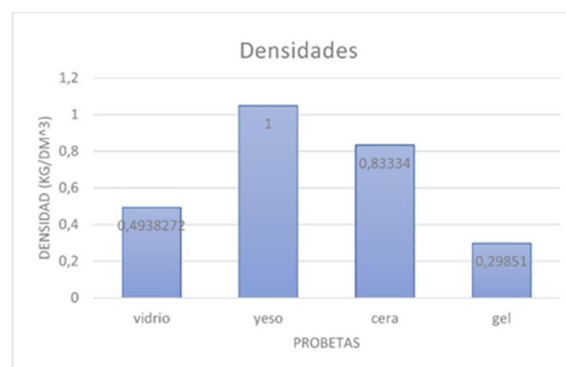
Fig. 5. Comparativo de densidades