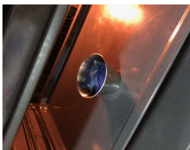
Fig. 3. Fundido de las muestras de PET en el horno

Posteriormente cortamos en trozos más pequeños el PET y los introducimos en el molde recién creado, tapamos los agujeros del molde con un trozo de esparadrapo para que no se derrita en el horno, y lo introducimos en este a una temperatura de 260 °C para pasarlo a estado líquido y poder obtener el material.