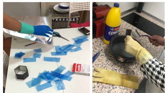
Fig. 1. Proceso de corte de las radiografías (izquierda) y lixiviación de la plata de éstas (derecha)

Comenzamos lavando y cortando las radiografías en trozos pequeños y sumergiéndolas en un barreño lleno de lejía para poder separar la plata y el PET.