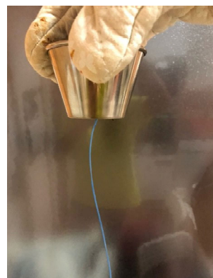
Fig. 4. Fabricación de fibras de PET

Finalmente, una vez conseguido su estado líquido el plástico lo sacamos del horno rápidamente, y con un mismo bote igual sin agujerear, presionamos para que vaya saliendo el plástico por el agujero anteriormente hecho.