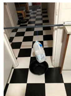
Fig. 5. Dispositivo de ensayo de tracción

El montaje consta de un palo de fregona colocado paralelo al suelo, atamos un extremo del hilo al centro del palo. El otro extremo soporta una garrafa de peso inicial de 175 g y capacidad máxima de 5 litros.