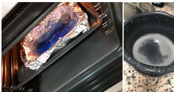
Fig. 2. Proceso de deshidratación del plástico en el horno (izquierda) y purificación de la plata (derecha)

Tras más de 12 horas de reposo de la disolución, y una vez la plata sedimentada, extraemos la lejía utilizando varias jeringuillas y vertemos la mezcla en un vaso de precipitado. La lejía restante, la disolvemos con agua destilada para facilitar su evaporación y evitar riesgos. Tras este proceso se calienta el vaso de precipitado con la disolución en la vitrocerámica, obteniendo así el polvo de plata puro. Esta plata se utilizará para hacer más eficiente este proyecto.