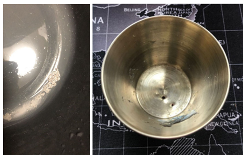
Fig. 2. Disolución de plata en agua destilada (izquierda) e imagen de un molde tras ser agujereado para la fabricación de las fibras (derecha)

Una vez terminado el paso anterior, se hacen los moldes ya agujereados con un clavo y un martillo (clavo de acero y punta fina) (Fig. 2, derecha).