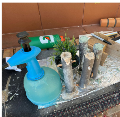
Fig. 2. Curado de las muestras dentro de los moldes (tuberías de goma)

Para la realización de las probetas empleamos unas tuberías de goma espuma de 20 cm de largo y 18 mm de diámetro, que pueden verse en la Fig. 1. Una vez rellenamos los cilindros con cada una de las mezclas las dejamos reposar 72 h en un ambiente seco y a temperatura ambiente, dentro de un cobertizo de madera. Fabricamos 2 probetas para cada porcentaje de aditivos, de tal manera que pudiésemos realizar tanto un ensayo de tracción y un ensayo Charpy para cada una de las composiciones.