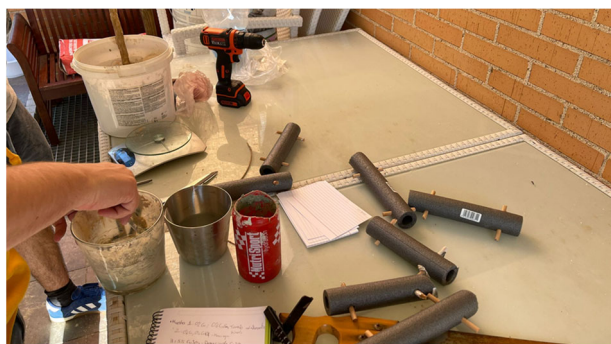
Fig. 1. Proceso de fabricación de las muestras

tenía una textura demasiado seca como para poder formar el mortero, y decidimos nuevamente aumentar la proporción de agua, hasta un 34 %.