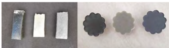
Fig. 1. Probetas

En cuanto a la resina mezclada con marmolina hemos de realizar el mismo proceso postulado anteriormente pero previamente a la adición el catalizador debemos añadirle la marmolina, para nuestra probeta hemos utilizado un porcentaje de 16,7% de marmolina con respecto al volumen total de la resina. Esta probeta tiene unas medidas de 1,8 cm de espesor y 9,7 cm de largo x 4,2 cm de ancho.