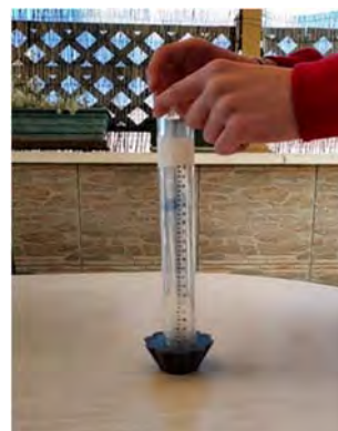
Fig. 2. Ensayo de Dureza Shore