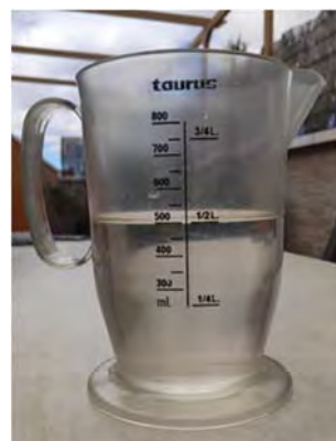
Fig. 4. Vaso de precipitados