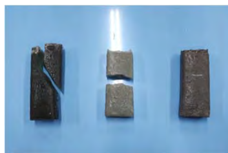
Fig. 7. Probetas tras el ensayo de compresión

En la Tabla 3 se tienen los datos obtenidos mediante el método ya explicado anteriormente y el dato de la densidad calculado con su fórmula.