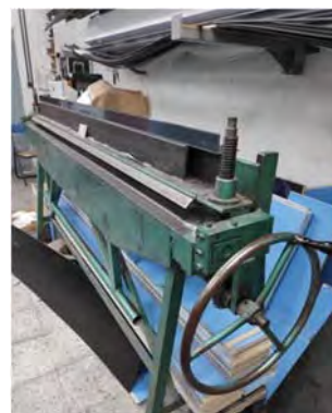
Fig. 3. Plegadora