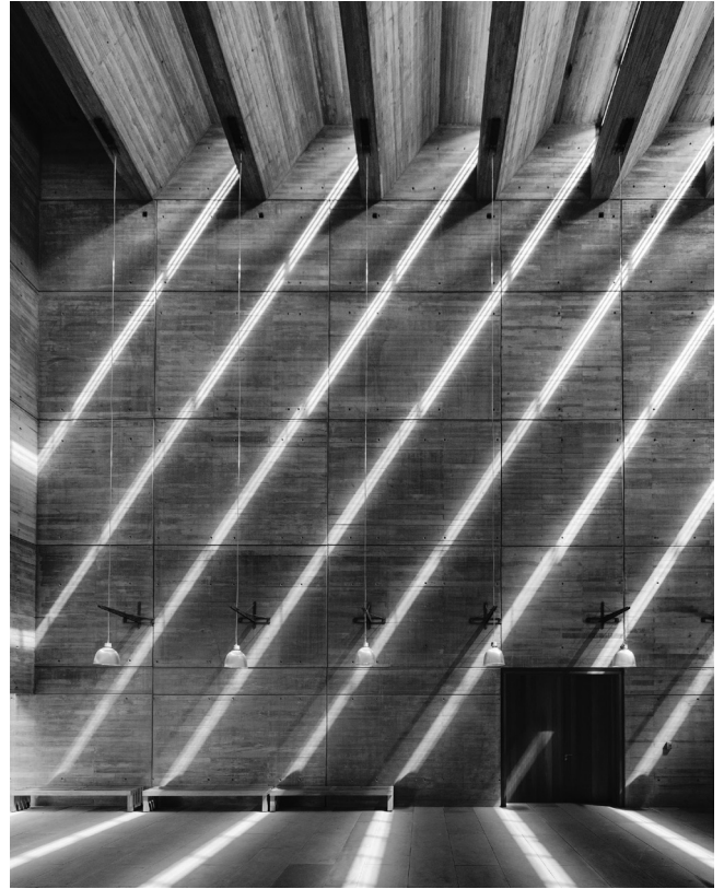
Fig. 4 Vista interior del vestíbulo principal. Mendaro Arquitectos, 2016.

Obra ampliamente galardonada a cada lado del Atlántico, es definido por importantes arquitectos mexicanos como aquel que “tiene el destino innegable de ser parte de los edificios que definirán la ciudad, que definirán nuestra cultura” 2 . Su innegable calidad y atemporalidad prometen seducir a esa “dama algo anticuada para los tiempos que corren” a la que el filósofo Javier Gomá procura cortejar tanto como puede. “Posteridad es su nombre” 3 .