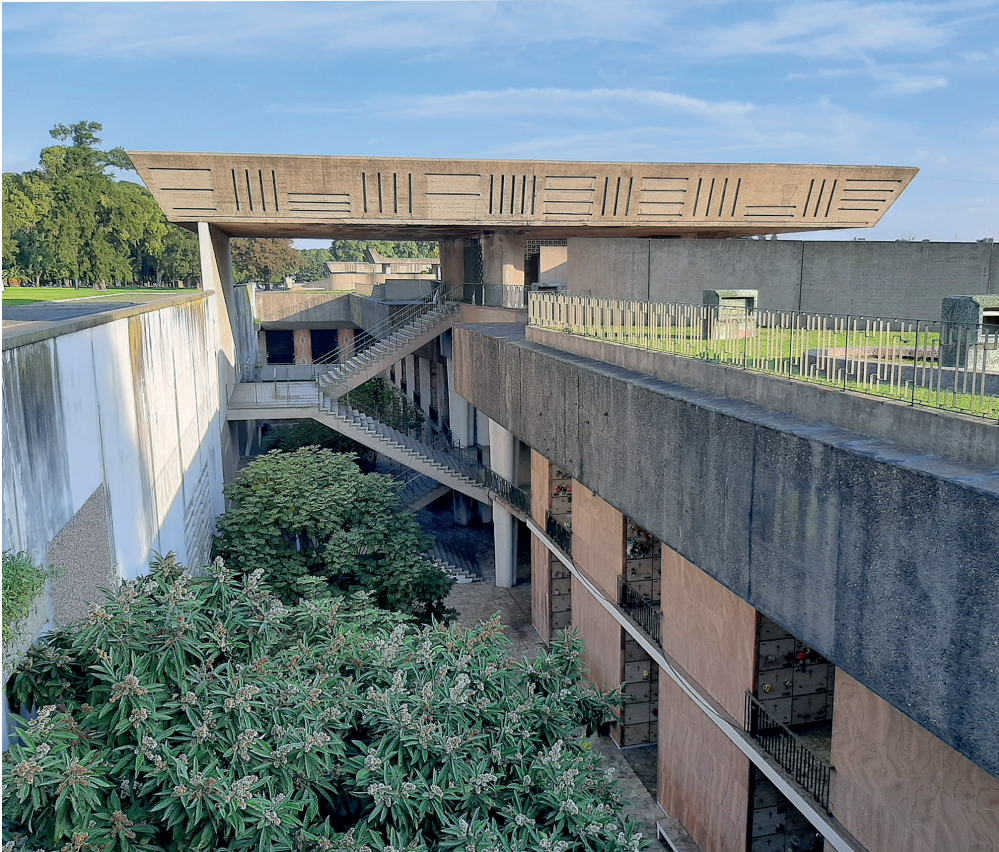
Figura 3. Patio entre las galerías 15 y 16 del Cementerio de la Chacarita, Buenos Aires.

racional de enterramientos se proyectó un gran jardín en la cota superior, a la misma altura que los paseos del cementerio. De esta manera, el corazón densificado del cementerio se convertía en un amplio jardín, un corazón verde en una necrópolis saturada que, como la propia ciudad necesitaba de áreas de esparcimiento («Panteones» 1961: 35-52). La cubierta ajardinada de esta arquitectura enterrada se hacía así accesible como ámbito de acogida en el ritual de la despedida.