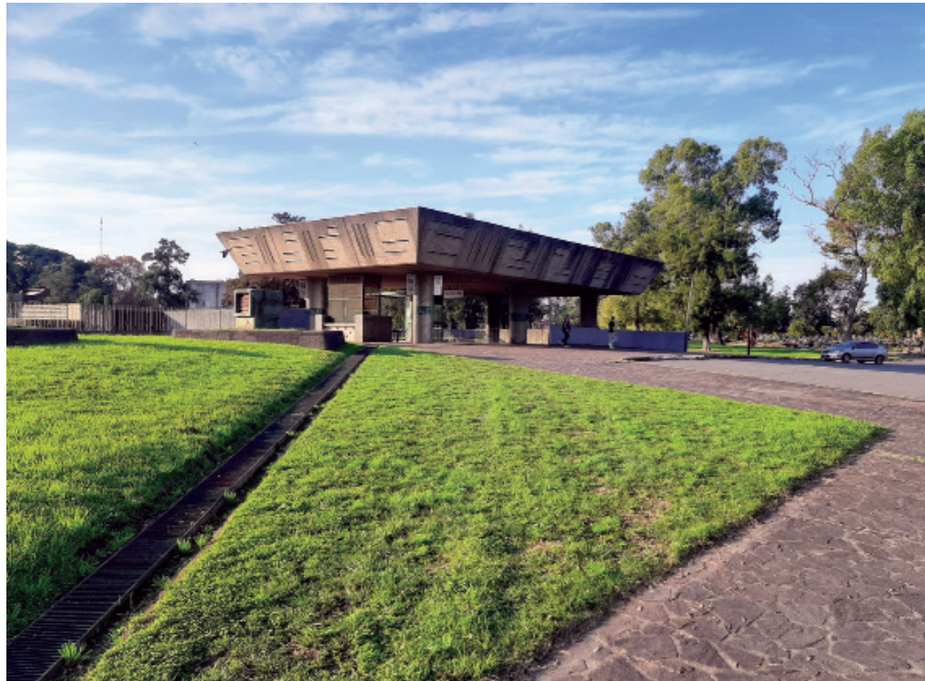
Figura 2. Jardín superior del Cementerio de la Chacarita con la cubierta sobre uno de los núcleos de comunicación, Buenos Aires.

con la cota general del cementerio (figura 1). Discípula de Carlos María Della Paolera —uno de los primeros urbanistas del país— y como única arquitecta del núcleo fundacional del grupo Austral, que trató de trasladar los presupuestos de los CIAM a la Argentina, Ítala Fulvia Villa aplicó a la ciudad de los muertos algunos de los principios modernos que otros miembros del grupo habían desarrollado previamente en el Plan Director para Buenos Aires (1937-1940), iniciado por Le Corbusier (Le Corbusier, Jeanneret, Ferrary Hardoy y Kurchan 1947: 1-53). La propuesta también se nutría de los proyectos urbanos que ella misma había proyectado, como el plan para el desarrollo de Flores, localidad que acabó anexionándose a Buenos Aires y en cuyo cementerio también intervino, racionalizando recorridos, abriendo las galerías a la luz y al aire y sustituyendo algunos muros del cerramiento por taludes de césped y bandas de arbustos espinosos que extendían en el perímetro la jardinería moderna de los nuevos patios. También aquí, Clorindo Testa dejó su huella en los relieves con los que se dignificó su vestíbulo principal (Villa y Nazar 1945: 339-357).