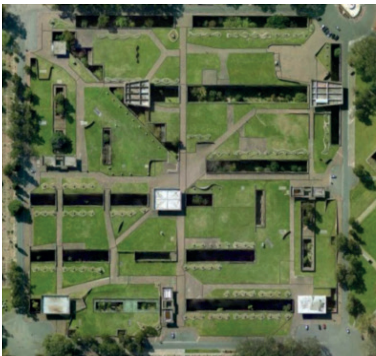
Figura 1. Cementerio de la Chacarita, Buenos Aires, con la intervención de Itala Fulvia Villa en el centro.

De esta manera, para no interferir con el perfil bajo de las construcciones existentes, dispuso dos pisos de galerías subterráneas rematadas en cubierta con un jardín enrasado