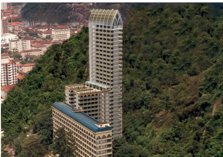
Figura 8. Necrópole Ecuménica con render de la futura ampliación de 32 plantas, Santos, Brasil.