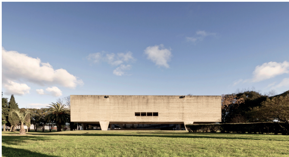
Figura 6. Alzado norte del Urnario 2 del Cementerio del Norte, Montevideo, de Nelson Bayardo.