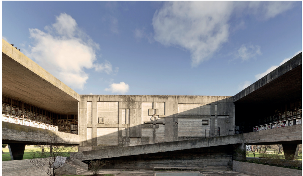
Figura 7. Patio del Urnario 2 con el relieve de Edwin Studer, Cementerio del Norte, Montevideo, de Nelson Bayardo.

mármoles y oropeles, y apostó por una arquitectura desnuda que confiaba su expresión a la rotundidad de su volumen y a la belleza descarnada del hormigón visto puestos al servicio de las necesidades psíquicas y sociales del ser humano en el momento trascendental de la despedida de un ser querido.