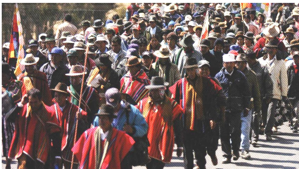
Figura 3. Fotografía del “Cerco Aymara”

Tres instituciones operacionales del ‘ayllu’ son no solo significativas, sino siempre recurrentes en todo acto comunal: la reciprocidad o ‘ayni’, la solidaridad o ‘minka’ y la redistribución o ‘laqinuqa’.