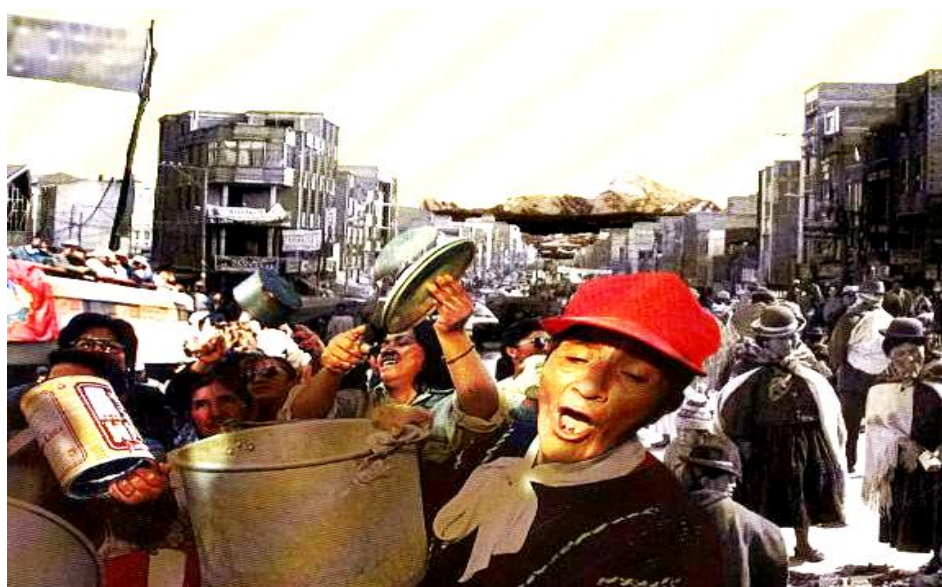
Figura 4. Fotografía del Bloqueo o “Pirka”