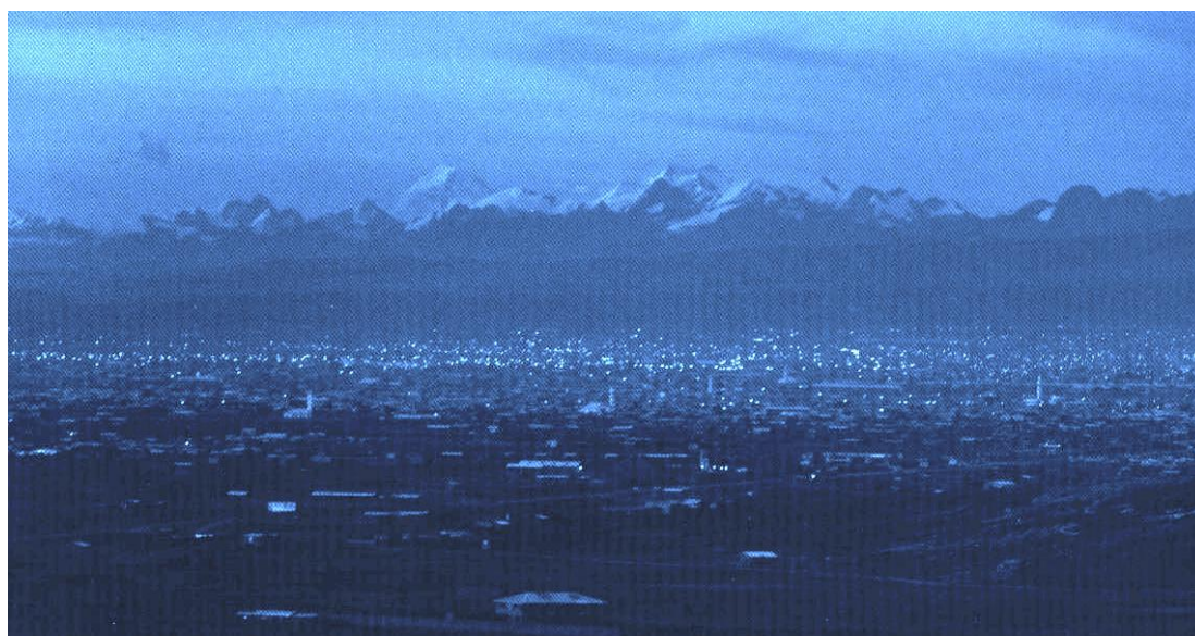
Figura 5. Fotografía de la Ciudad de El Alto

“El Ayllu procede de la revolución verde, desde cuando los aymaras domesticaron a las plantas, ocasionando, además de la revolución agraria, una transformación en las formas organizativas de la sociedad. La estructura social del Ayllu responde a la necesidad de complementar suelos, de hacer circular los productos, de hacer rotar los trabajos. Los mandos rotativos del poder comunitario son un resultado estructural de esa rotación agrícola en el campo de disponibilidad de fuerza”. 24