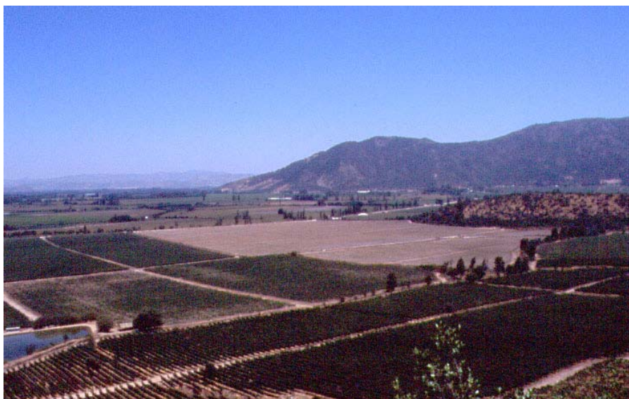
Figura 2. Terrenos de Viña Montes.