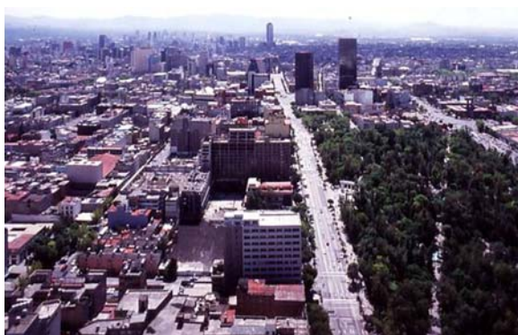
Figura 3: Vistas de la ciudad de México. La ciudad de México habla muy mal de los urbanistas, ningún plan de desarrollo urbano ha podido detener la especulación edilicia, ni el crecimiento acelerado hacia los cuatro accesos principales a la ciudad. Se pronostica que en el año 2040 la ciudad de México contará con 40 millones de habitantes, ya que la mancha urbana se unirá a las vecinas ciudades de Toluca, Puebla, Cuernavaca y Pachuca.

La actividad de un proyecto integral, tanto en arquitectura mineralizada como en la arquitectura vegetal, permite la reordenación o recalificación del medio ambiente de manera más redituable y menos costosa. Los componentes del verde urbano no son la cosmética de la cara desfigurada de la ciudad que ha crecido mal, como la misma Ciudad de México, esta ciudad habla muy mal de los urbanistas, es decir, del maquillaje que esconde y mimetiza las deformaciones.