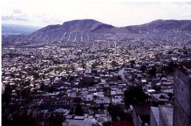
Figura 4: Vistas de la periferia norte de la ciudad de México. Los espacios abiertos existen y se encuentran en gran cantidad, son recursos expuestos a desperdicios inútiles, actualmente son áreas ausentes de ideas.

Los árboles, por sí solos, no son útiles para cubrir los errores del urbanismo tradicional. En México se ha construido o recalificado la ciudad sobre la vía de la incoherencia y del desperdicio de recursos naturales y humanos. La arquitectura de los espacios abiertos debe ser entendida como un elemento de calidad para diseñar, planificar y conservar la ciudad histórica actual con una renovada jerarquía de sus valores históricos, ecológicos y artísticos, entre los cuales se enlazan la arquitectura y el medio ambiente, utilizando para este fin la arquitectura de los vacíos en una relación lógica, como entre masculino y femenino, entre polo positivo y polo negativo, sin la subordinación del uno al otro.