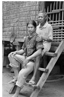
Actualmente trabaja en el Servicio Jesuita para los Refugiados y se encarga de documentar casos de nuevas víctimas de minas antipersona.