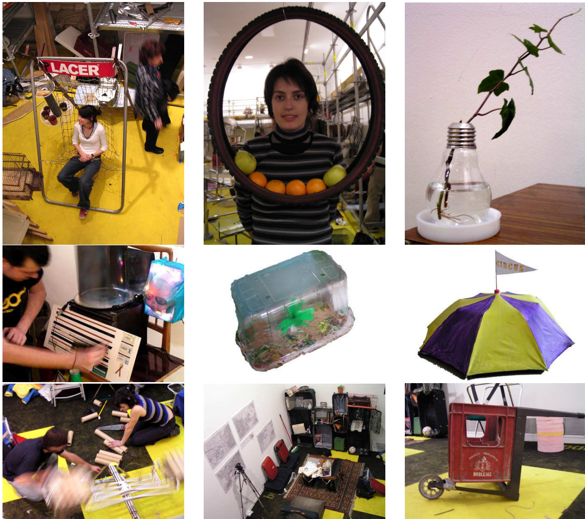
FIGURA 13: Taller—concurso de reciclaje Basurama04