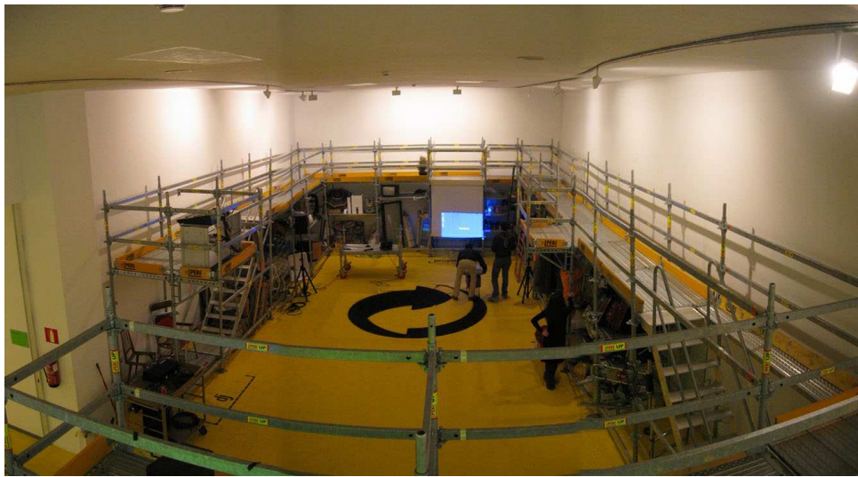
FIGURA 10: Espacio A de la Casa Encendida