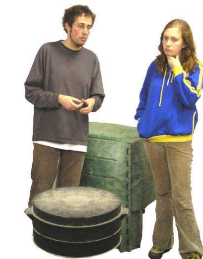
FIGURA 4: Amigos de la Tierra y sus compostadoras