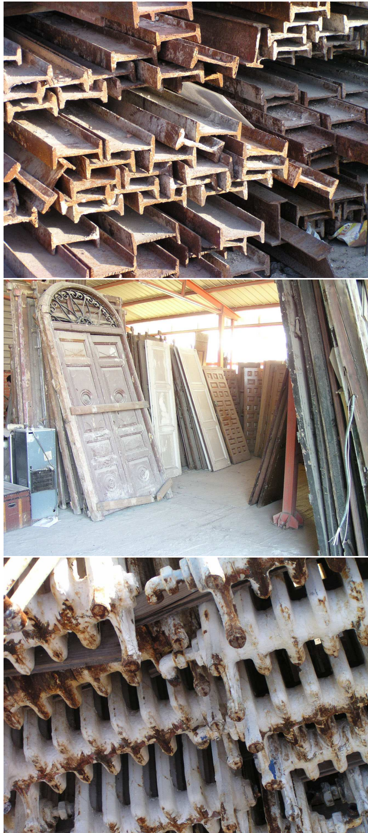
FIGURA 1: Almacén—supermercado de DETECSA