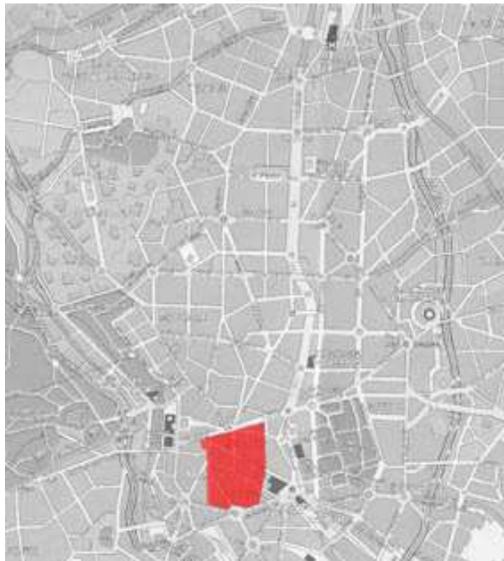
FIGURA 7: Safari basura: el lugar explorado fue el Centro de la ciudad de Madrid