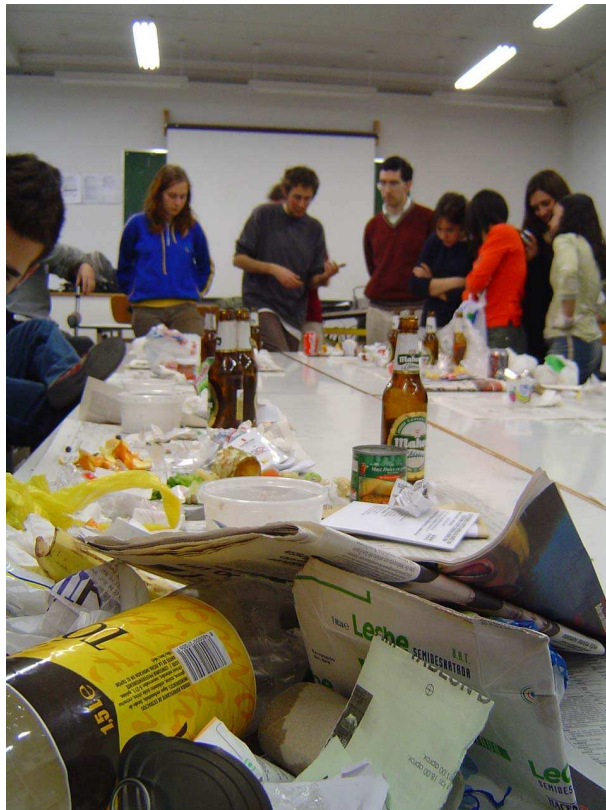
FIGURA 6: Momento de trabajo en el taller de compostaje