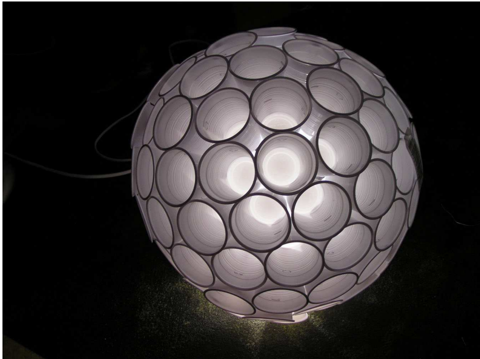
FIGURA 12: Primer premio del concurso en Basurama04