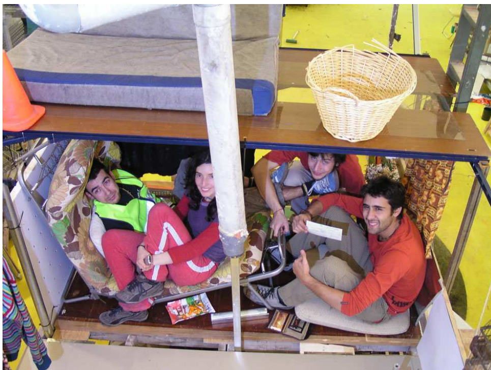
FIGURA 11: Grupo premiado por la mejor recogida dentro de su propuesta para el concurso