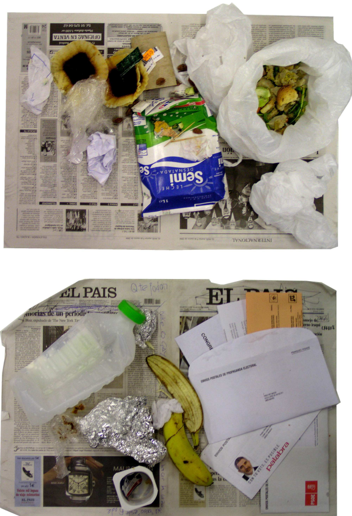
FIGURA 5: Basura producida por dos de los participantes desde las 16:30 del lunes 8 de marzo hasta las 16:30 del día siguiente