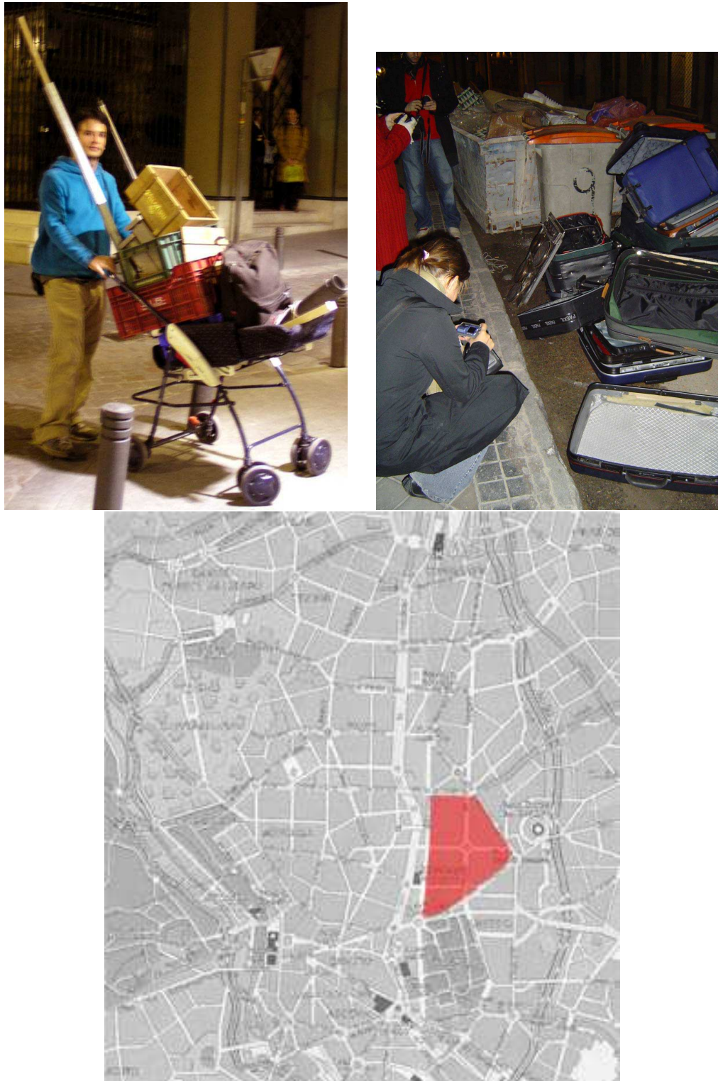
FIGURA 9: Safari basura: el lugar explorado fue el Barrio de Salamanca