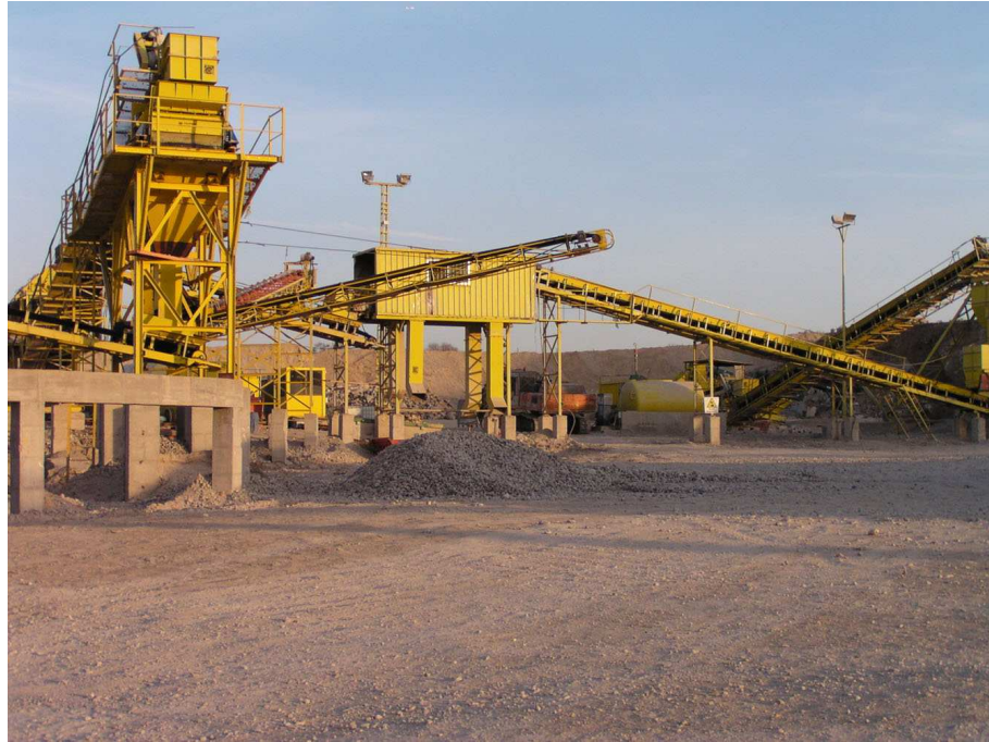
FIGURA 2: Planta de reciclado de hormigón