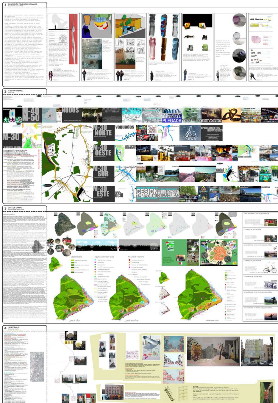
FIGURA 2: Visión conjunta de las propuestas (01).