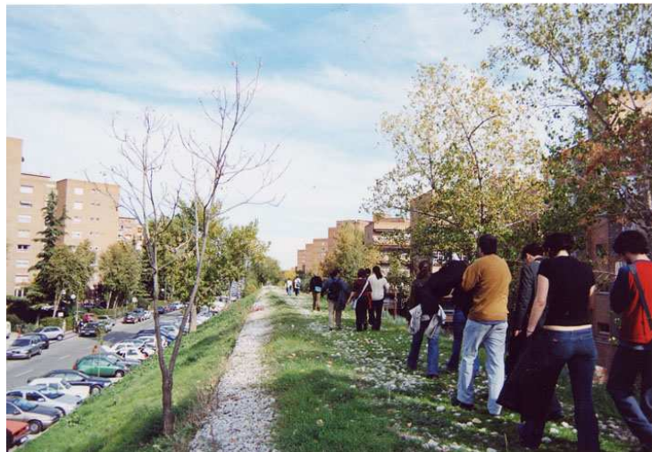
FIGURA 3: Viaje a Retiro Sur

Centro Social Seco. Más información en http://seco.sinroot.net/