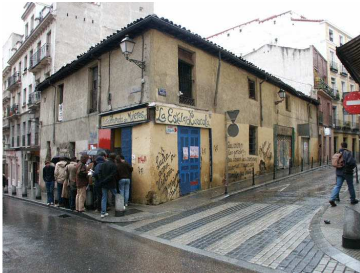
FIGURA 5: Viaje a Lavapiés (02): La Tabacalera

La Tabacalera: Antigua fábrica de tabacos Más información en http://www.latabacalera.net