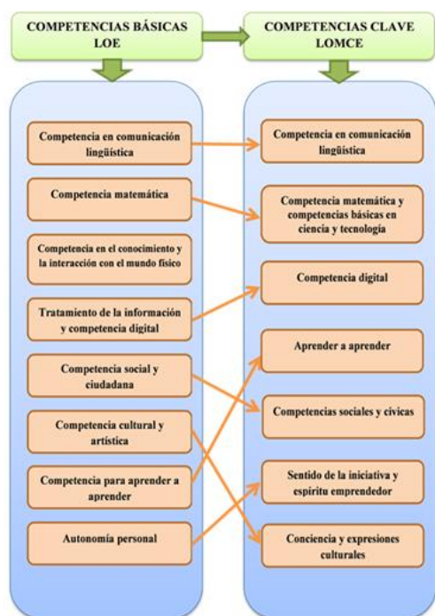
Fig. 2: Modificación de Competencias Básicas (LOE) a Competencias Clave (LOMCE) (Fuente: elaboración propia).

Como aclaración, se debe mencionar que las ciudades de Ceuta y Melilla, aunque poseen autonomía (concedidas a través de sus correspondientes estatutos de autonomía, aprobados por la Ley Orgánica 1/1995, de 13 de marzo, de Estatuto de Autonomía de Ceuta [10] y Ley Orgánica 2/1995, de 13 de marzo, de Estatuto de Autonomía de Melilla [11]; respectivamente), carecen de competencias legislativas en materia de educación, por lo que se rigen por la legislación estatal anteriormente especificada, es decir, es competencia del actual Ministerio de Educación y Formación Profesional (Ministerio de Educación, Cultura y Deporte hasta el 2 de junio de 2018).