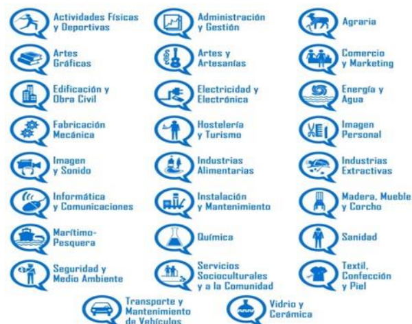
Fig. 3: Familias Profesionales de la Formación Profesional. (Todofp.es, 2018). (Fuente: http://todofp.es/que-como-y-donde-estudiar/que-estudiar/familia/loe.html ).

Tanto la Formación Profesional de Grado Medio como la de grado Superior se encuentran organizadas en torno a 26 familias profesionales.