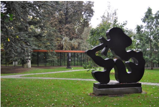
Fig. 5. Imagen del Museo Louisiana inmerso en la naturaleza del parque donde se ubica, Humlebaek (Dinamarca).

Sorpresa: se incluyen elementos capaces de alterar el ritmo de trabajo esperado de los objetivos parciales. Incluye cualquier otro tipo de estímulo inesperado que obligue a una rápida adaptación a la situación.