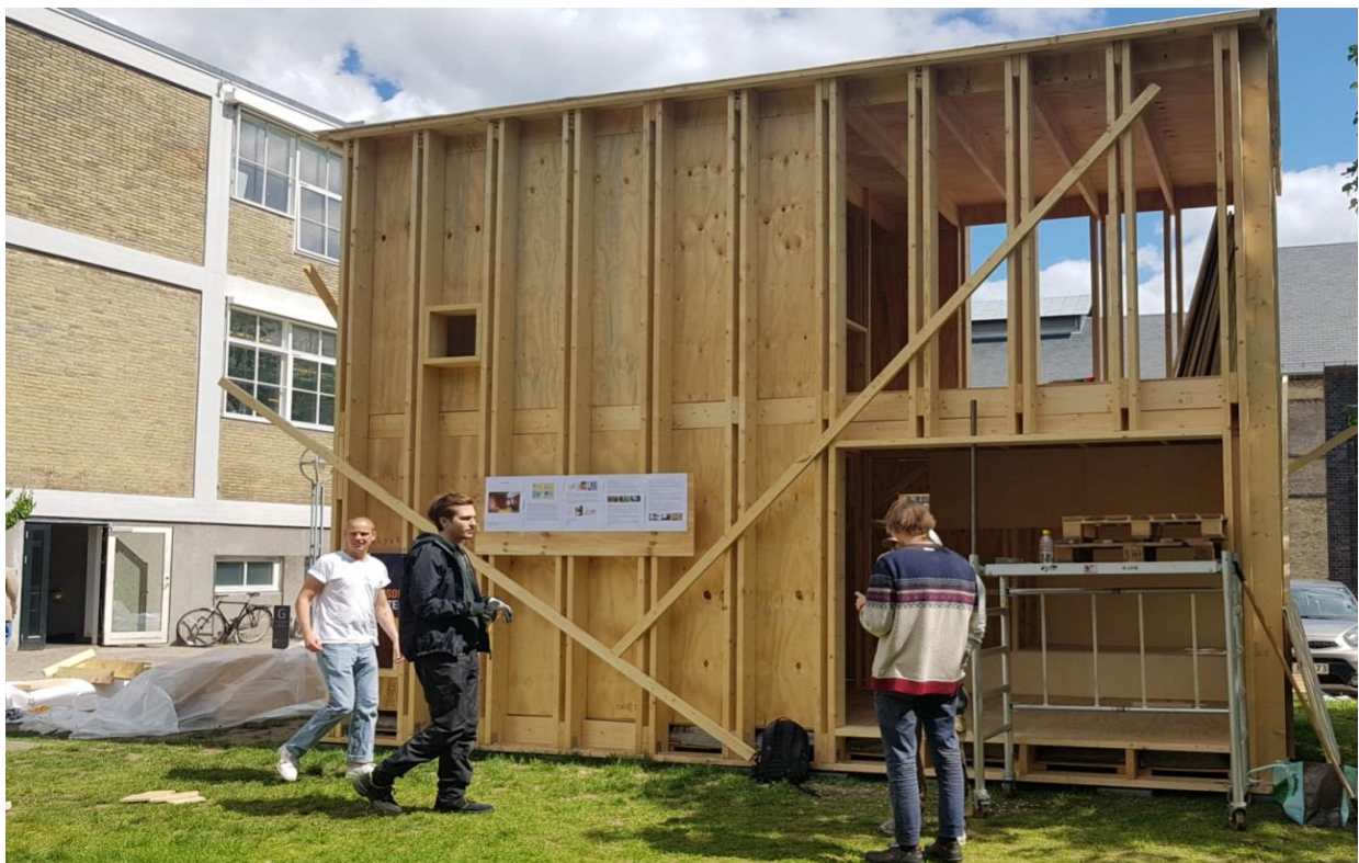
Fig. 4: Estudiantes de grado de Master de Arquitectura del Instituto de Arquitectura y Diseño auto-construyen una pequeña construcción temporal desarrollando un exquisito trabajo de carpintería, sobre los jardines de la Escuela de Arquitectura, en la KADK.

Teniendo en cuenta que los juegos son sistemas complejos con multitud de variables, no es una tarea fácil crear un juego efectivo, instructivo y que sea divertido. El juego solo será eficaz si previo a su diseño definimos bien los objetivos, y las diferentes etapas del juego [9]. Hay que determinar los elementos componentes del juego, y que incentivos o recompensas