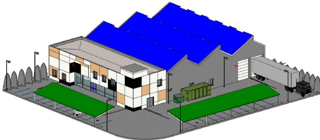
Fig. 2: Carpinter3a, venta de muebles de madera y administraci3n.

En la Fig. 4 se muestra otro ejemplo de establecimiento compuesto por carpinter3a y zona de exposici3n y venta de muebles.