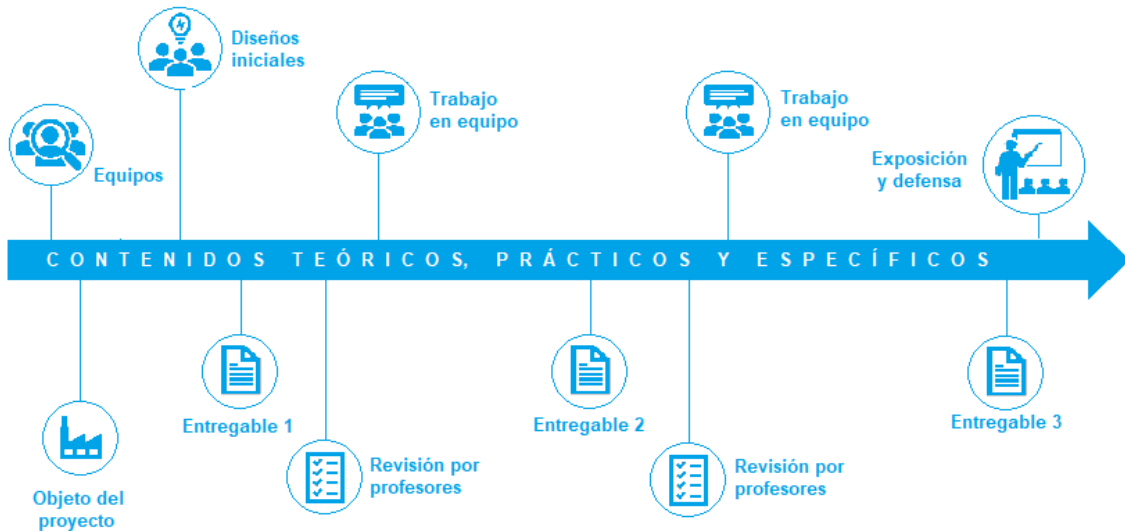
Fig. 1: Programación temporal de actividades del curso.