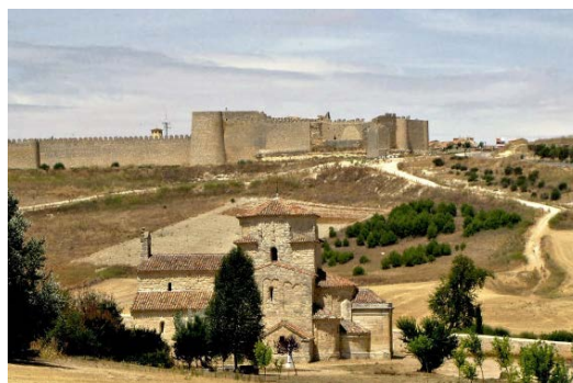
Figura 3. Urueña: ubicación.