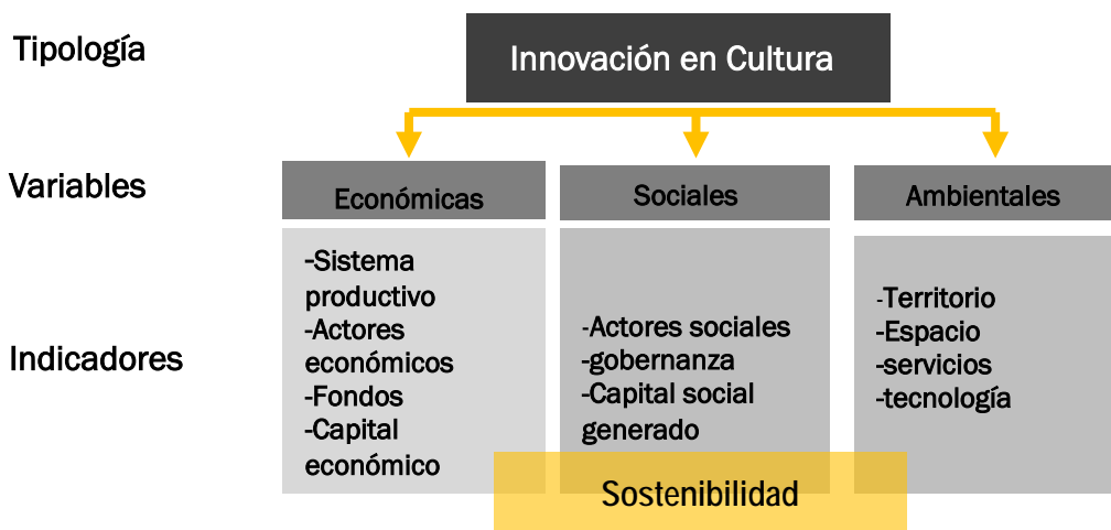
Figura 2. Innovación en Cultura: Variables e indicadores.

En nuestra investigación se partió del análisis de distintos casos de innovación, y tomando en cuenta su naturaleza, se identificaron cinco tipologías: las culturales, las turísticas, las de agricultura ecológica, las de recuperación del patrimonio construido y las de gestión pública. Para el caso de la innovación cultural, sujeto de este artículo, se parte del supuesto que “la innovación en cultura es un camino para la recuperación de los pueblos tradicionales”, y en consecuencia se establecen las variables claves de su éxito: económicas, sociales y ambientales (Figura 2), derivadas de la investigación, que se corresponden además con las variables de sostenibilidad establecidas en la Agenda 2030.