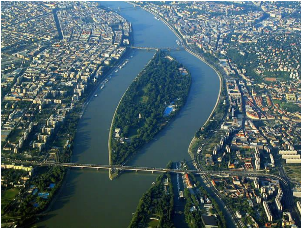
Imagen: (Parque urbano Isla Santa Margarita – Budapest Hungría)

Como icono de la regeneración de este modelo urbano y tomando la propuesta sobre la isla de Zorrozaurre, la propuesta que presenta este modelo es crear un gran parque urbano, al estilo de la isla de Santa Margarita de Budapest. En este caso los costos de limitación de la inundabilidad y urbanización son menores que en la propuesta de Zaha Hadid, y los retornos deberán ser cuantificados de una forma holística, tal y como a continuación veremos, y no a través de la enajenación y venta de aprovechamientos urbanísticos creados desatendiendo la perspectiva real y que lo único que generan es desequilibrio en la ciudad.