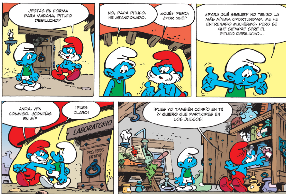
Figura 3. PEYO. Los Pitufos Olímpicos, Barcelona: Norma Editorial, 12, 2014, p. 24, plancha 20, 2ª y 3ª línea. © Peyo - 2014 - Licensed through I.M.P.S. (Brussels) www.smurf.com; © 2014, NORMA Editorial por la edición en castellano.