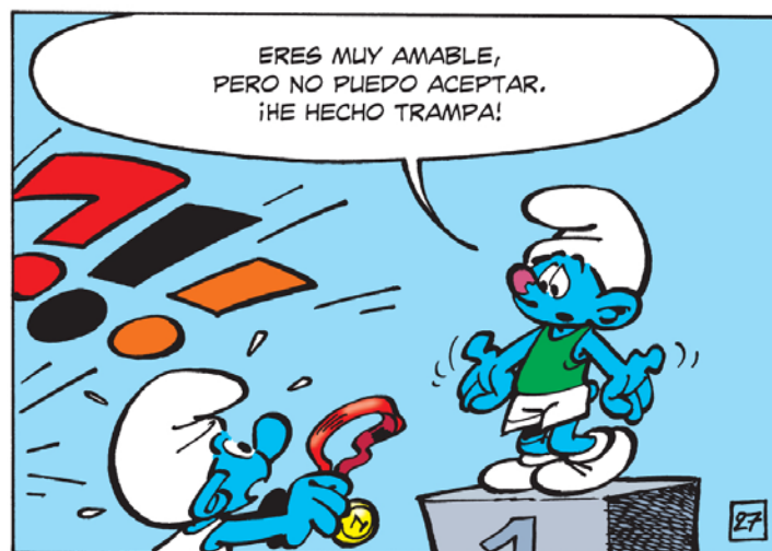
Figura 4. PEYO. Los Pitufos Olímpicos, Barcelona: Norma Editorial, 2014, p.31, plancha 27, 4a línea, 3a viñeta. © Peyo - 2014 - Licensed through I.M.P.S. (Brussels) - www.smurf.com; © 2014, NORMA Editorial por la edición en castellano.

Mientras que el lector parece convencido del dopaje del más débil de los hombrecillos azules bajo la dirección de Papá Pitufo , aprende en el último momento, en las últimas viñetas de la última plancha de la historia ilustrada, que Pitufo debilucho no se ha dopado, o mejor dicho, sólo ha ingerido jalea de grosella y no potentes e ilegales “estimulantes”.