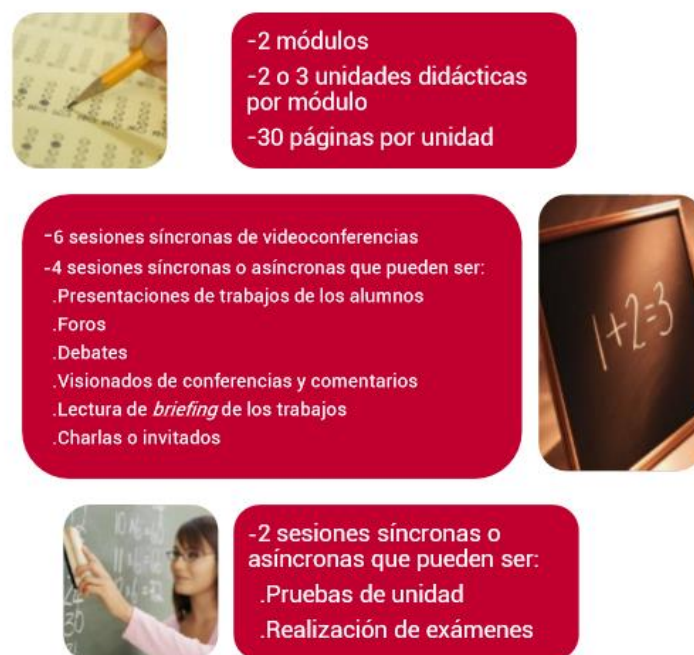
Figura 3. Referencias para la conformación de curso online de 2 ECTS