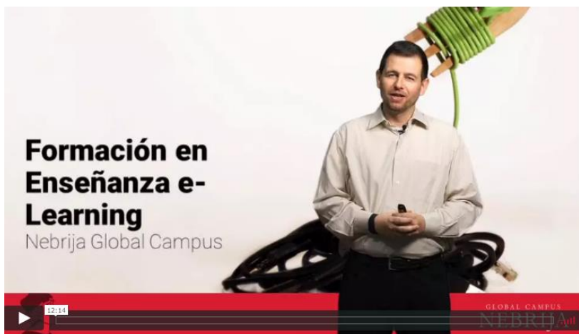
Vídeo de introducción a eTeacher