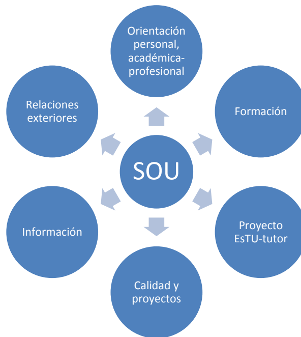
Figura 1. Estructura de red radial cooperativa del Proyecto SOU-estuTutor.