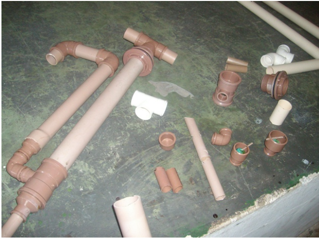
Figura 6. Montaje Bomba Carcará 2.

inoperativas y sin manutención ofrecida. Por ello, la bomba Carcará 2 está siendo instalada con cola y además se están estudiando modificaciones para mejorar la sujeción.