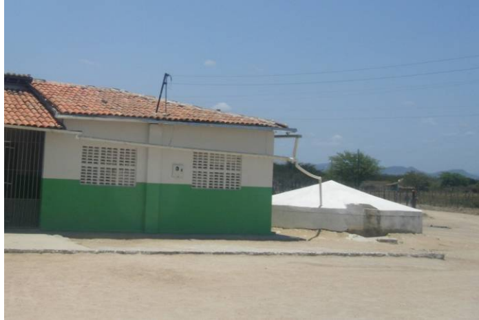
Figura 1. Cisterna de captación de agua de lluvia en una escuela de Major Isidoro, Alagoas.

En lo que se refiere a la construcción, es necesario tener en cuenta que la cisterna debe estar enterrada de la mitad a dos tercios de su altura. Su totalidad consiste en placas de cemento con tamaño de 50 por 60 centímetros, y con 4 a 5 centímetros de espesura, curvadas de acuerdo con el radio proyectado en la pared de la cisterna. Las placas están fabricadas en el local de construcción en moldes de madera o hierro. Para evitar que la pared se caiga, durante la construcción, las placas son colocadas con argamasa de cemento y se espera un período de 8h para que la masa del cemento esté seca. En seguida, se enrolla alambre de acero galvanizado en el lado externo de la pared de la cisterna. Después, es hecho un pretensado en cada alambre de acero que rodea la cisterna para mejorar la fijación y soporte de presión después del llenado; posteriormente, es hecho el revoco interno y externo.