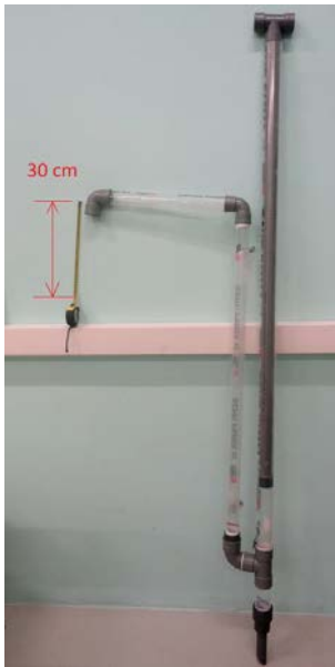
Figura 8. Bomba Carcará 2 de metacrilato.