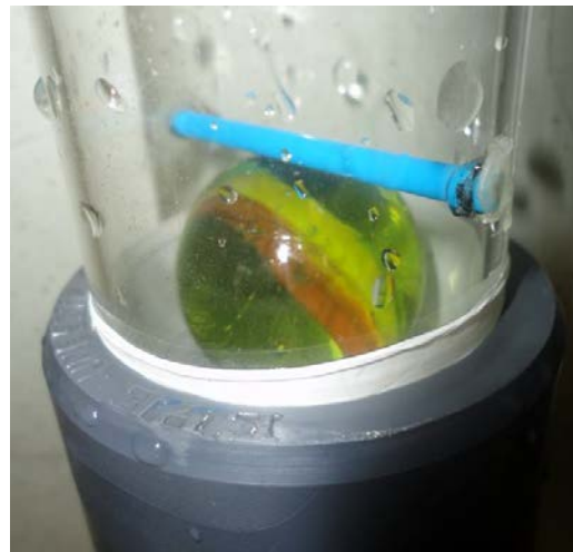
Figura 11. Detalle válvula superior.

Una vez tengamos todo lo anterior empezamos el ensamblaje. Forramos con teflón las extremidades de los tubos restantes y la parte macho del codo de 50. Luego metemos el tubo de metacrilato de 50x46 de 150cm en la Te 50 90 grados PVC y en el extremo colineal de la Te el otro tubo de metacrilato de 50x46 de 13cm, en el final de este, que previamente tiene la válvula inferior, colocamos el tubo de 25. En el extremo faltante de la Te de 50 colocamos el codo de 50 M-H al cual previamente se le pego la válvula superior con el tubo de metacrilato de 40 de 100cm continuando con el codo de 40, tubo de metacrilato de 40 de 40cm, codo de 40 y tubo de metacrilato de 40 de 10cm de longitud.