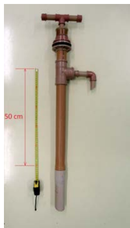
Figura 4. Bomba Carcará 1.