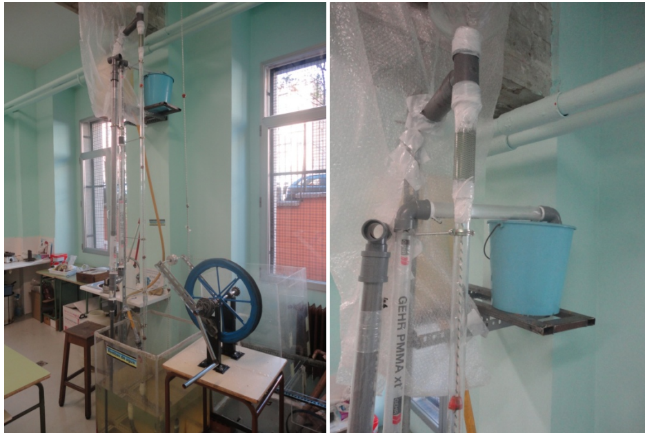
Figura 12. Montaje y detalle de altura para comparativa BM-II y Bomba Carcará 2 en metacrilato.