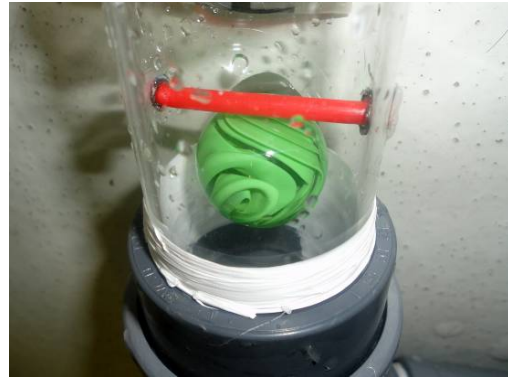
Figura 14. Montaje en tubo.

Otro aspecto importante es la holgura entre el pistón y el tubo sobre el que desliza, ya que de ella depende la capacidad de succión, cuanto menos holgura haya, más succión. En la bomba a escala traída desde Brasil pudimos observar que el pistón es fabricado de tal forma que el tapón es introducido por su exterior en el interior del tubo de 40, precalentando el borde y luego se recorta su exterior de forma que entre en el tubo de 50. Al disponer solo de las medidas dadas anteriormente para el metacrilato, la única solución que tuvimos fue poner un tapón de 50 y mecanizar su exterior e ir probando hasta que su deslizamiento fuese el adecuado.