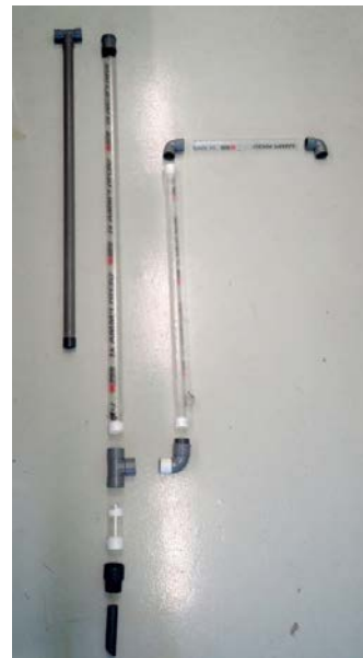
Figura 9. Esquema de montaje.

En el laboratorio de “Hidráulica Aplicada al Desarrollo” de la ETSIDI se construyó un modelo de la bomba Carcará 2. En su construcción disponemos de los siguientes materiales y herramientas: