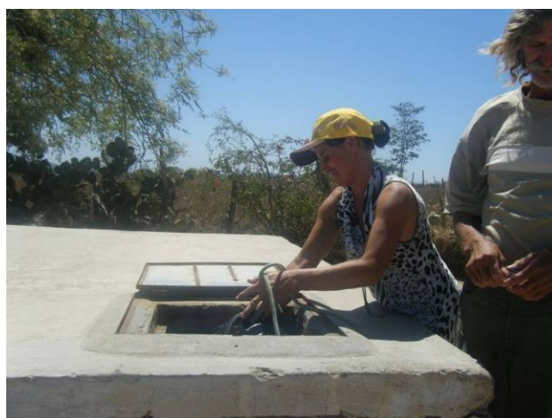
Figura 3. Extracción del agua de una cisterna antigua con balde y cuerda en una escuela de Canapi, Alagoas.

La bomba Carcará 2 desempeña un papel fundamental para prevenir la contaminación dentro de la cisterna. En la primera toma de contacto del equipo UPM (que incluyó la visita de 58 escuelas del programa) se detectó que más del 90% de escuelas que ya tenían cisternas antes del proyecto (muchas de ellas deterioradas o mal conservadas) extraen el agua por el método tradicional, con un balde atado a una cuerda (Figura 3). Ello puede provocar la contaminación de la totalidad del agua de la cisterna. La bomba Carcará II reduce el riesgo de contaminación, permitiendo que la cisterna se mantenga siempre cerrada, incluso a la hora de la recogida.