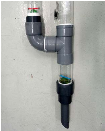
Figura 10. Detalle válvulas.

Repetimos el mismo procedimiento para la válvula superior en el tubo de metacrilato de 40 de 100cm, aquí tomaremos la reducción cónica de 50x25 y la bola de cristal será de 25mm.