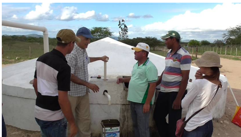
Figura 2. Instalación de la primera bomba Carcará 2 en una escuela de Major Isidoro, Alagoas. (Octubre/2012).

La cisterna está considerada construida (finalizada), solo una vez que sea identificada, georreferenciada, fotografiada y que la comunidad escolar por medio del director de la escuela firme un contrato declarando el recibimiento de la cisterna en perfecto estado.