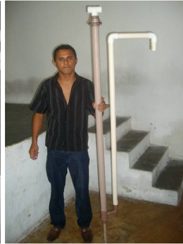
Figura 7. Montaje completo Bomba Carcará 2.