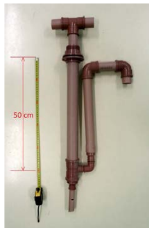
Figura 5. Bomba Carcará 2.

Las bombas Carcará 1 y 2 (Figuras 4 y 5) son parte del desarrollo de tecnologías sociales que se ajustan al programa de cisternas de placas gracias a su bajo coste y fácil construcción en la que, al igual que en la construcción de las cisternas de placas, la población es participe de su elaboración con herramientas sencillas haciendo que exista un compromiso social para la obtención de un bien común.