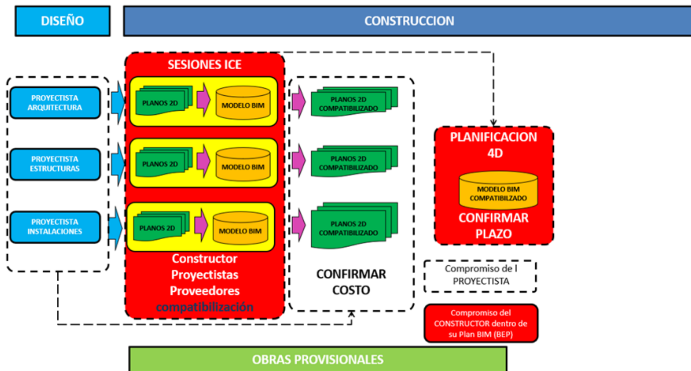
Ilustración 2: Propuesta de aplicación BIM para la construcción de proyectos públicos. Elaboración propia

el mismo alcance con el que se desarrolló el expediente técnico entregado para licitación) en base a la subsanación de los errores encontrados que han dado a la creación de un proyecto “verificado” en presupuesto y cronograma gracias a la aplicación de BIM. Un esquema de la propuesta descrita se encuentra en la ilustración 2.