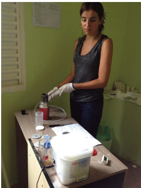
Figura 2. Kit de agua.

“Meta 2: Desarrollo del sentimiento de solidaridad y los hábitos de consumo, comercio y producción justos y responsables, desde una perspectiva sostenible del desarrollo.