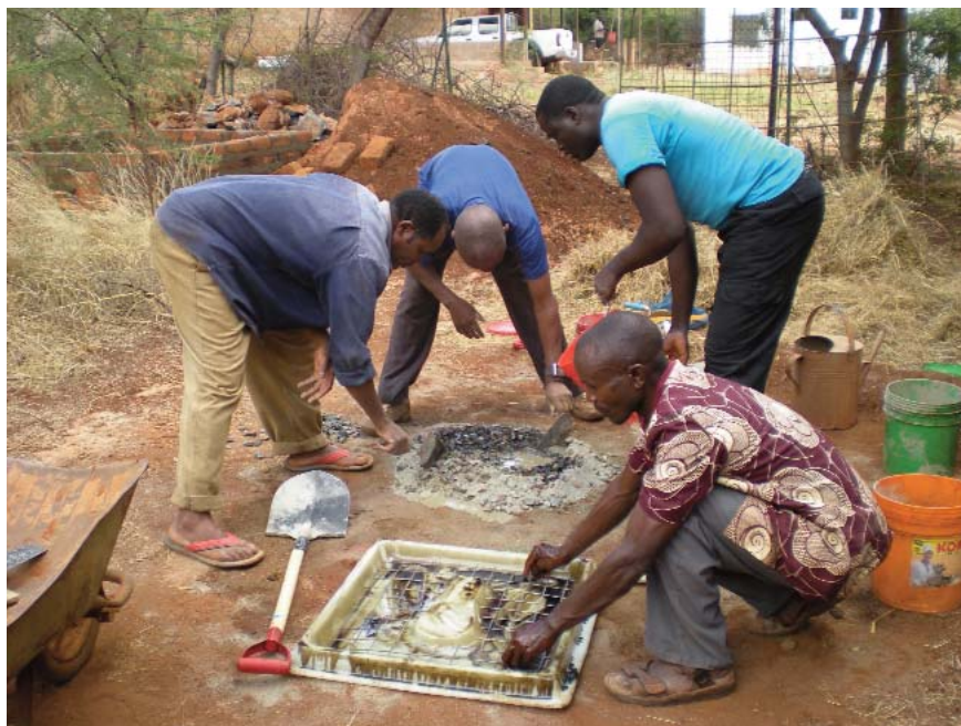
Figura 3. Albañiles construyendo una letrina en Kongwa - Tanzania (2014).

“Meta 4: Programa propio de Cooperación al Desarrollo de las Universidades españolas.