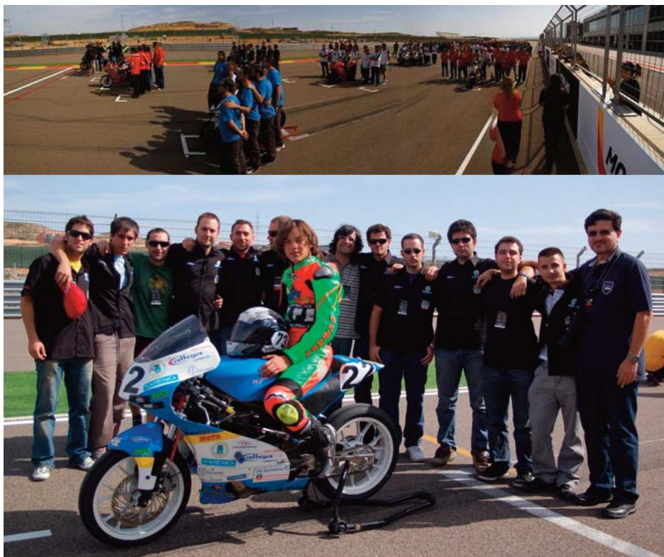
Figura 5. Parrilla de salida en la 1ª edición de MotoStudent 2009-2010

MotoStudent es una competición internacional bianual consistente en diseñar y desarrollar, por parte de equipos universitarios, un prototipo de moto de competición de pequeña cilindrada que compite con su evaluación pertinente. Los estudiantes deberán demostrar en un periodo de 18 meses que pueden desarrollar un prototipo de estas características y el modelo empresarial necesario para lograrlo, lo que justificarán con los oportunos estudios económicos y de negocio.