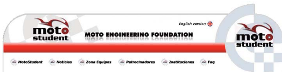
Figura 4. Cabecera y logo de la página web de MotoStudent

MotoStudent está organizada por la Fundación “Moto Engineering Foundation”, que es una entidad sin ánimo de lucro que tiene por objeto impulsar los contactos y las actividades de formación e innovación entre la industria de vehículos de dos ruedas y cuadriciclos, la Universidad y cualquier otra entidad relacionada con el sector del motor. Dentro de los patronos de esta fundación podemos reseñar: Dorna Sports, S.L., ANESDOR, la Real Federación Motociclista Española, MotorLand Aragón y la Universidad de Zaragoza, entre otros.